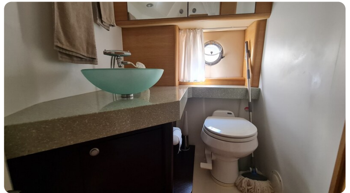
Cranchi 43 Méditerranée, bathroom view.jpg