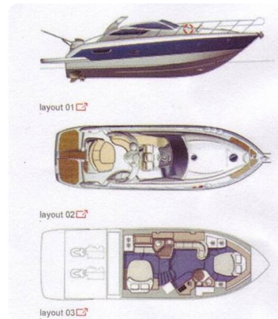
Cranchi mediterranee 43 layout