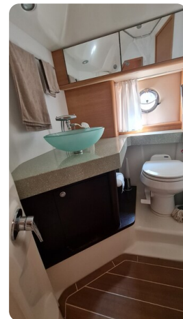
Cranchi 43 Méditerranée, bathroom.jpg