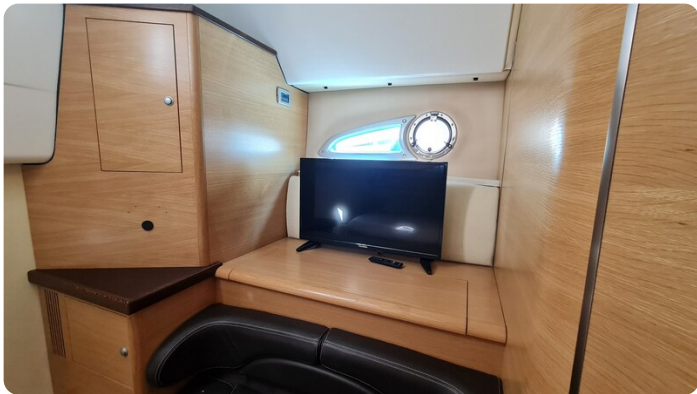
Cranchi 43 Méditerranée, details.jpg