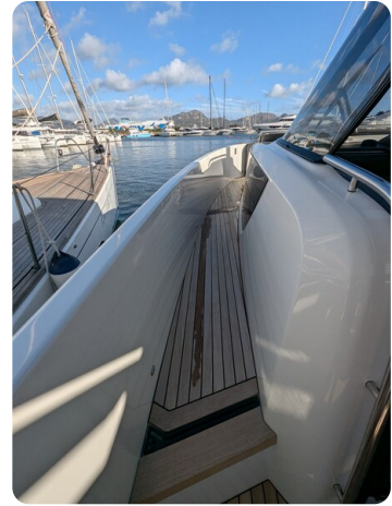
Cranchi 46 Luxury Tender sideways