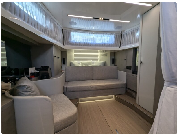
Cranchi 46 Luxury Tender convertible dinette