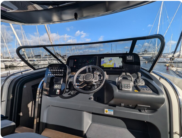
Cranchi 46 Luxury Tender helm station