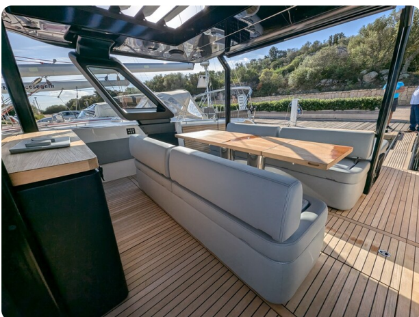
Cranchi 46 Luxury Tender cockpit dinette