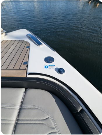
Cranchi 46 Luxury Tender bow shower