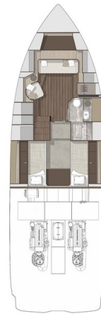
Cranchi 46 Luxury Tender layout