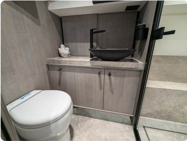
Cranchi 46 Luxury Tender bathroom