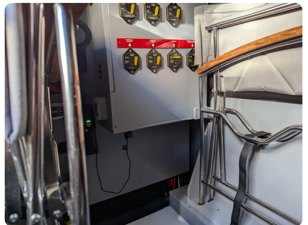
Cranchi 46 Luxury Tender detail