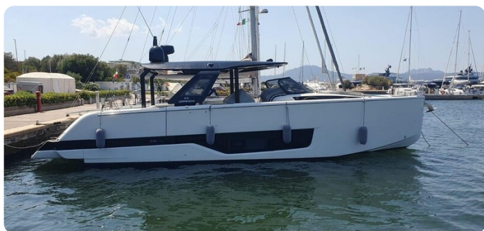
Cranchi 46 Luxury Tender profile