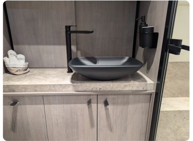
Cranchi 46 Luxury Tender bathroom detail