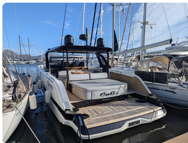
Cranchi 46 Luxury Tender aft profile