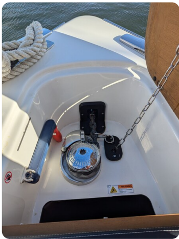
Cranchi 46 Luxury Tender bow windlass