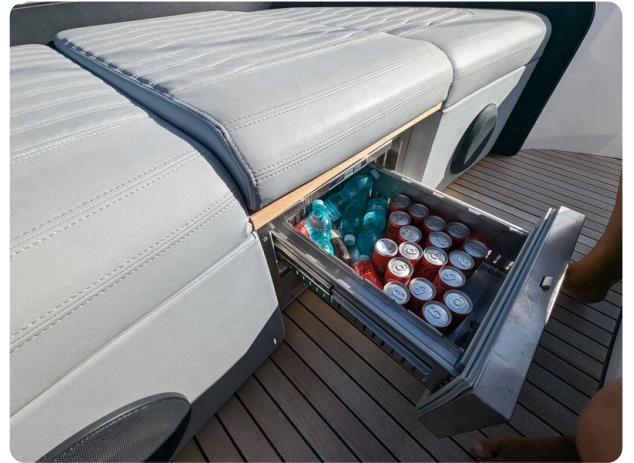
Cranchi 46 Luxury Tender fwd deck fridge