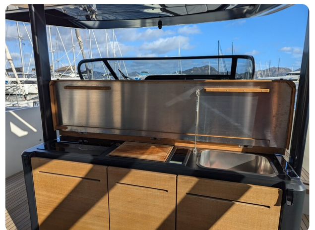
Cranchi 46 Luxury Tender galley