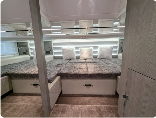
Cranchi 46 Luxury Tender master cabin