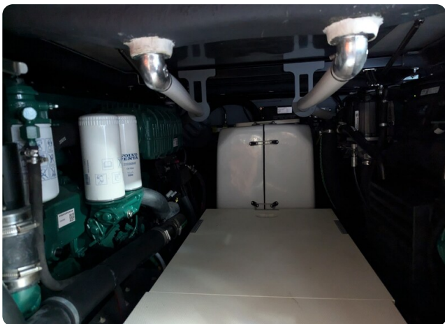
Cranchi 46 Luxury Tender engine room