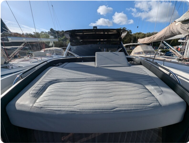
Cranchi 46 Luxury Tender fwd deck sunpad