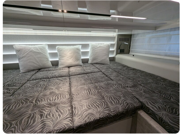
Cranchi 46 Luxury Tender master cabin detail