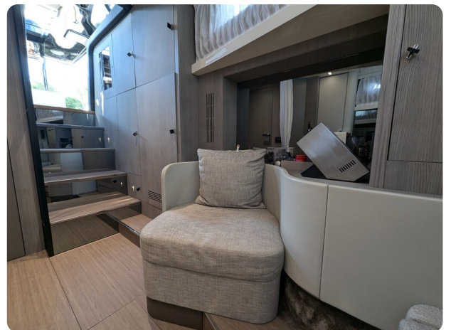
Cranchi 46 Luxury Tender cabin detail