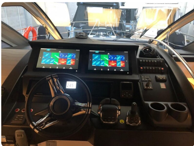
Cranchi 60 ST Helm Detail.jpg