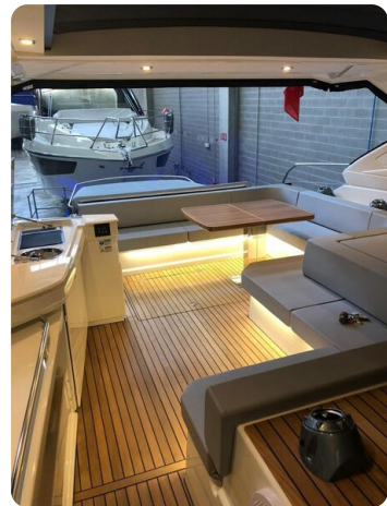
Cranchi 60 ST Cockpit Aft View.jpg