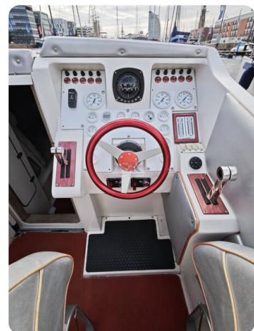
Cigarette 31 BULLET 11