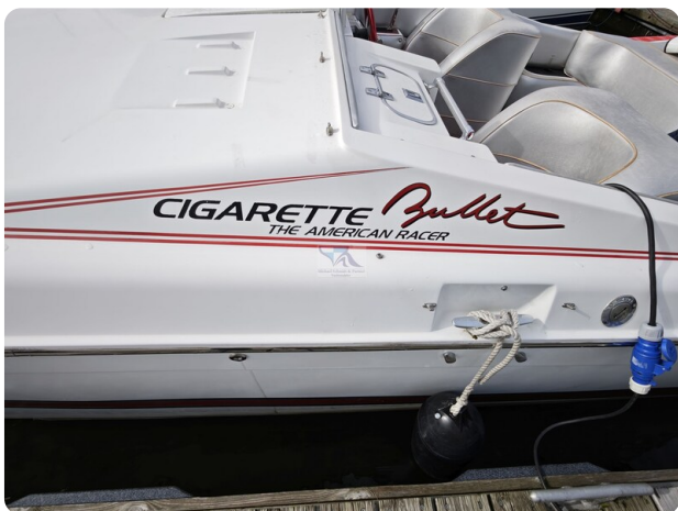
Cigarette 31 BULLET 10