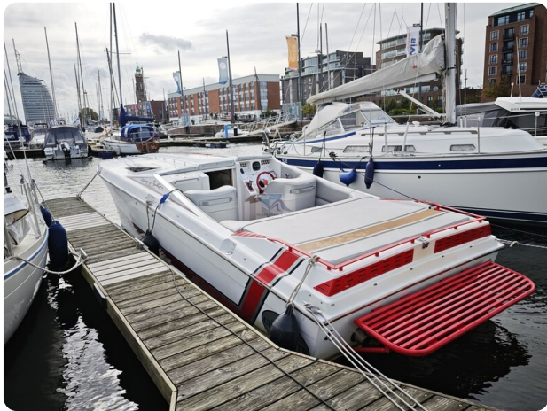
Cigarette 31 BULLET 47