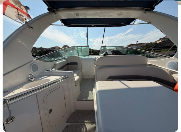
CHAPARRAL SIGNATURE 310 Cockpit