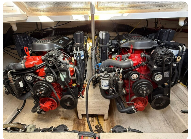
CHAPARRAL SIGNATURE 310 Engine room