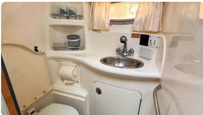
CHAPARRAL SIGNATURE 310 Toilette