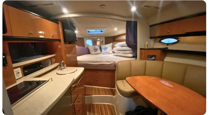
CHAPARRAL SIGNATURE 310 Cabin