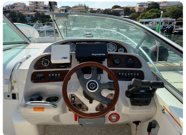
CHAPARRAL SIGNATURE 310 Helm console