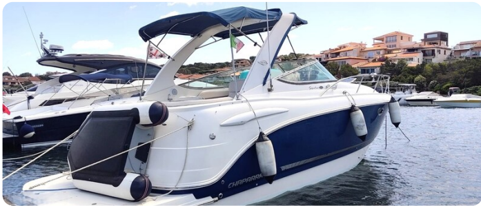
CHAPARRAL SIGNATURE 310 Aft Profile