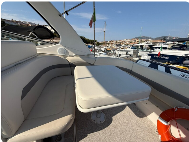
CHAPARRAL SIGNATURE 310 Dinette detail