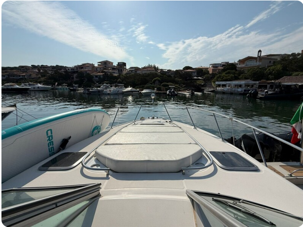
CHAPARRAL SIGNATURE 310 Bow sunbed