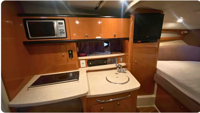
CHAPARRAL SIGNATURE 310 Galley