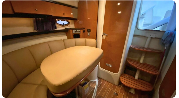
CHAPARRAL SIGNATURE 310 Dinette