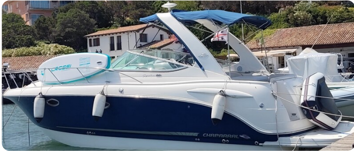
CHAPARRAL SIGNATURE 310 Profile