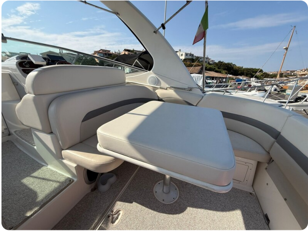
CHAPARRAL SIGNATURE 310 Table detail