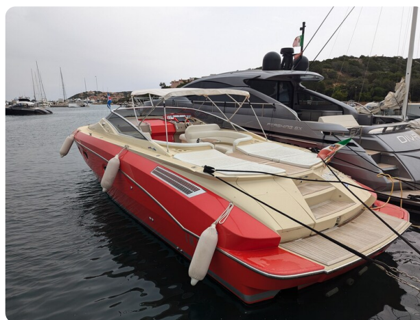
Sarnico Spider aft profile