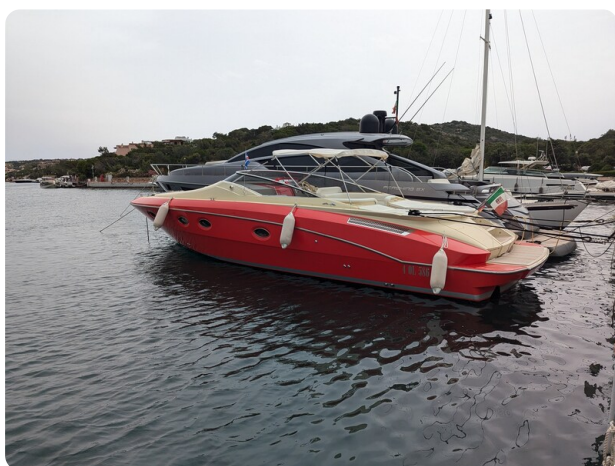
Sarnico Spider, profile