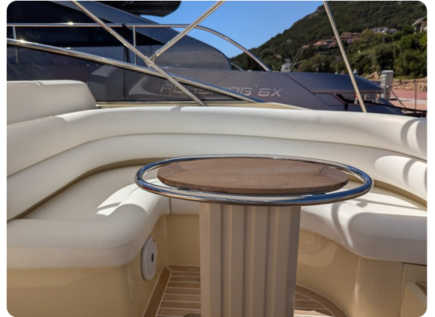
Sarnico Spider cockpit dinette