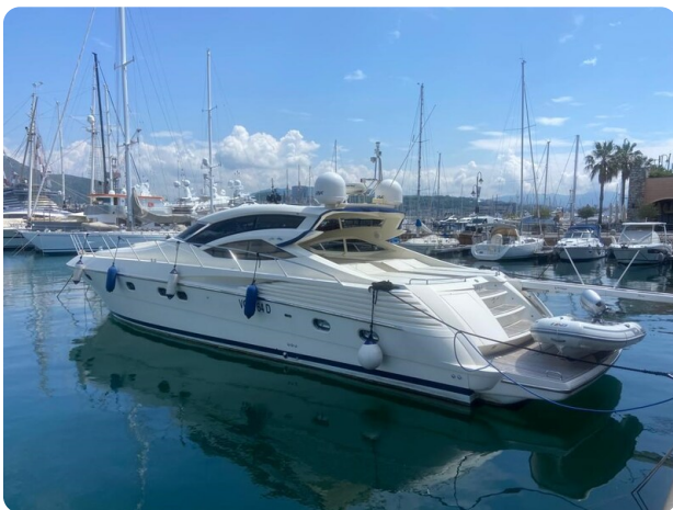
Sarnico 60 profile