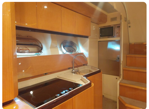
Sarnico 60 RiAl interior galley