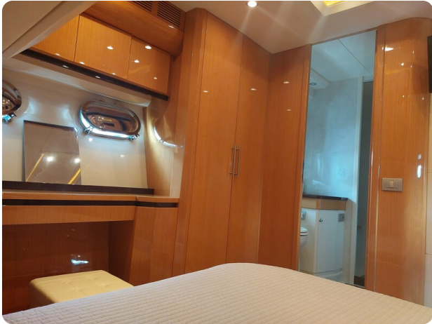
Sarnico 60 RiAl pics 141919