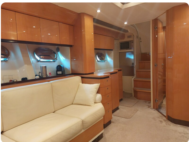
Sarnico 60 RiAl dinette and galley