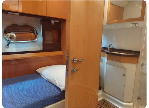
Sarnico 60 RiAl double cabin and wc