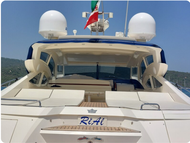
Sarnico 60 RiAl aft sunpad