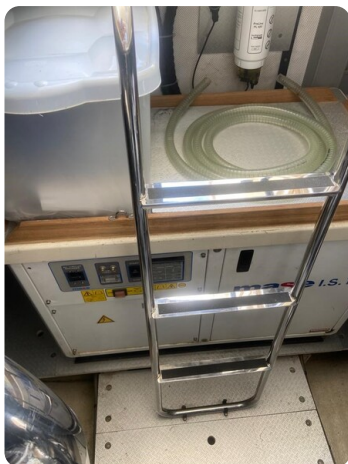
Sarnico 60, engine room