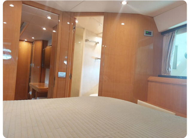
Sarnico 60 RiAl pics 141710