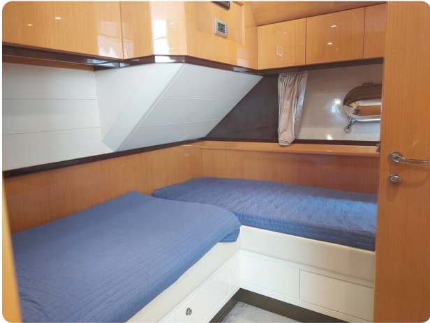
Sarnico 60 RiAl double cabin