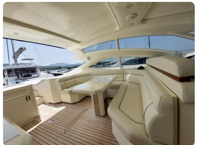
Sarnico 60 RiAl exterior dinette