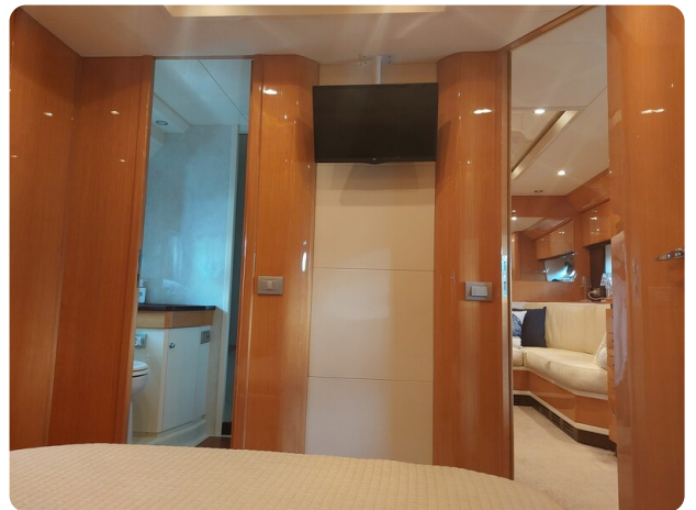
Sarnico 60 RiAl master cabin and toilette