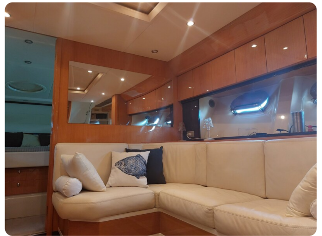
Sarnico 60 RiAl interior salon (1)