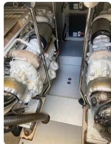
Sarnico 60 engine