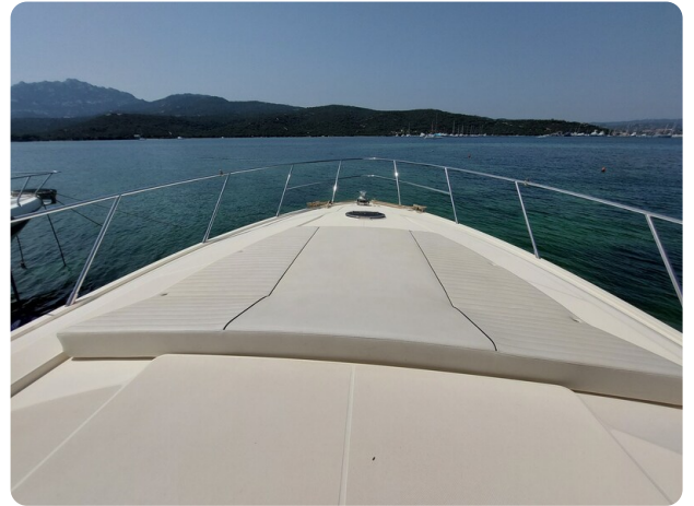
Sarnico 60 RiAl bow