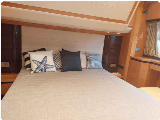
Sarnico 60 RiAl pics 141905