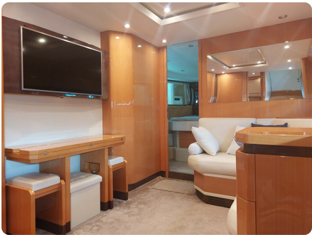
Sarnico 60 RiAl interior salon