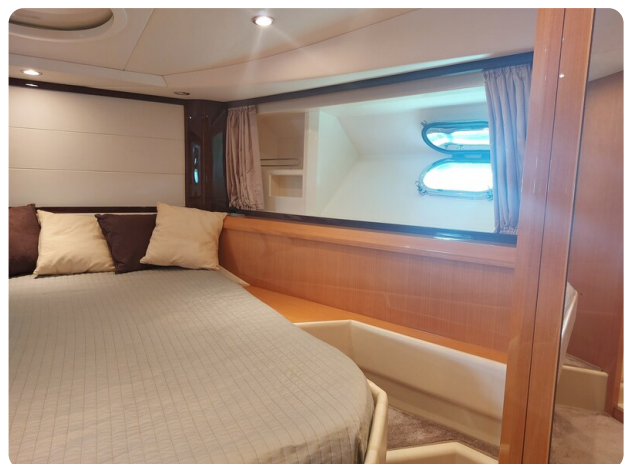
Sarnico 60 RiAl pics 141636