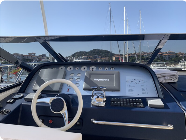
Cantieri di Sarnico 68 plancia