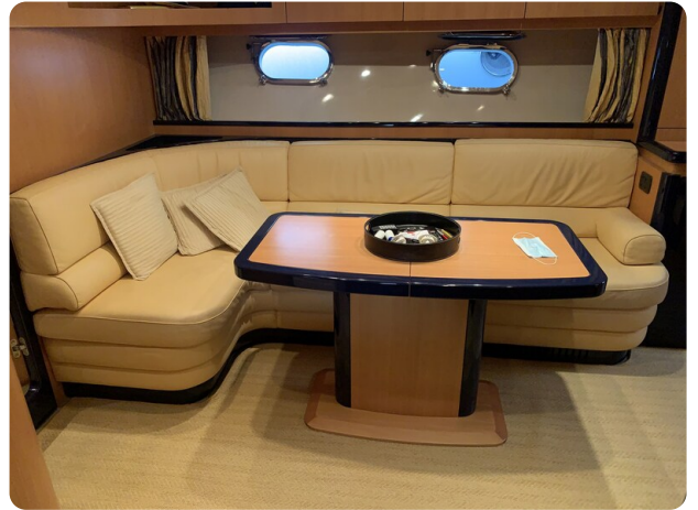
Sarnico 58 salon dinette