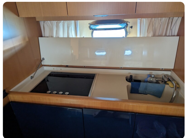
Sarnico 58 galley