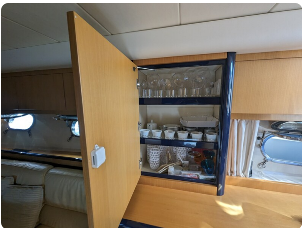
Sarnico 58 salon detail