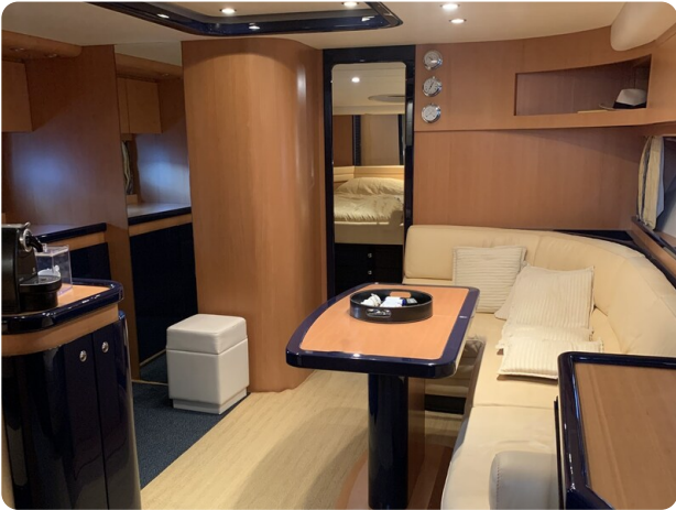
Sarnico 58 salon