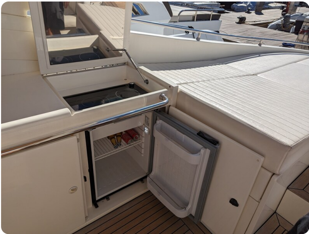
Sarnico 58 cockpit galley