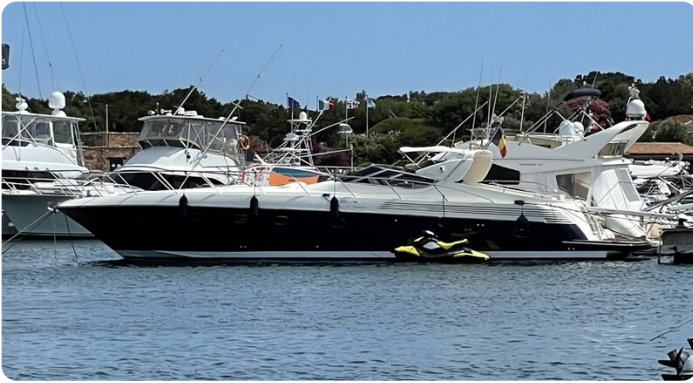
Sarnico 58 profile