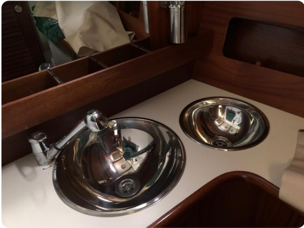
Guest cabin vanity 2