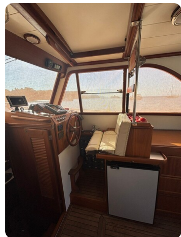
Helm station 1