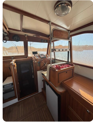
Helm station 4