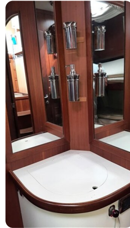
Guest cabin vanity