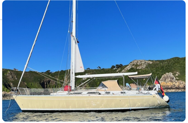
Grand Soleil 45 1