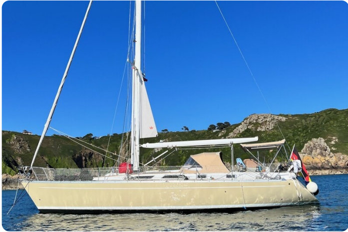
Grand Soleil 45 1