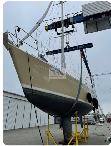
Grand Soleil 45 74