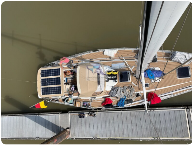
Grand Soleil 45 72