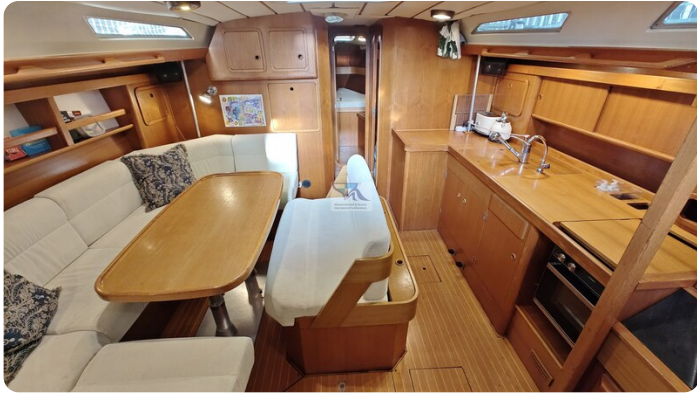
Grand Soleil 45 95