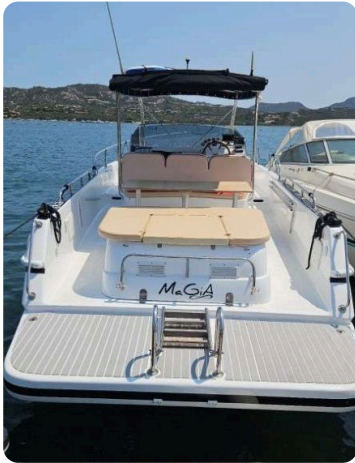
Canamer 33 ster view