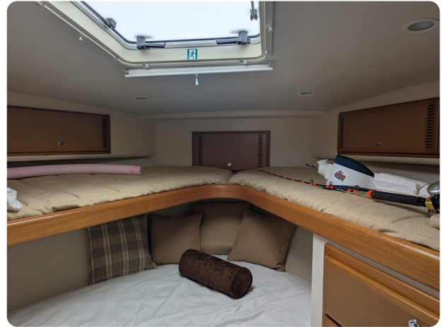
Cabo 38 Express cabin detail