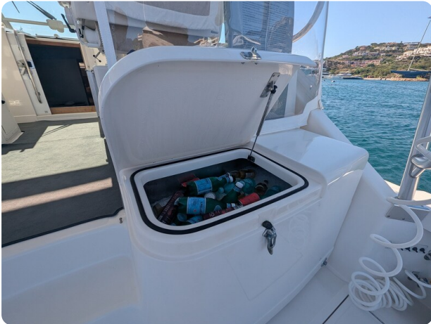
Cabo 38 Express cockpit icebox