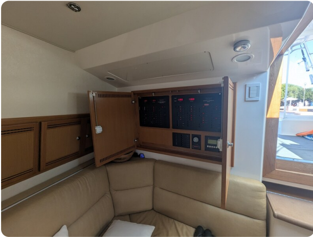
Cabo 38 Express salon detail