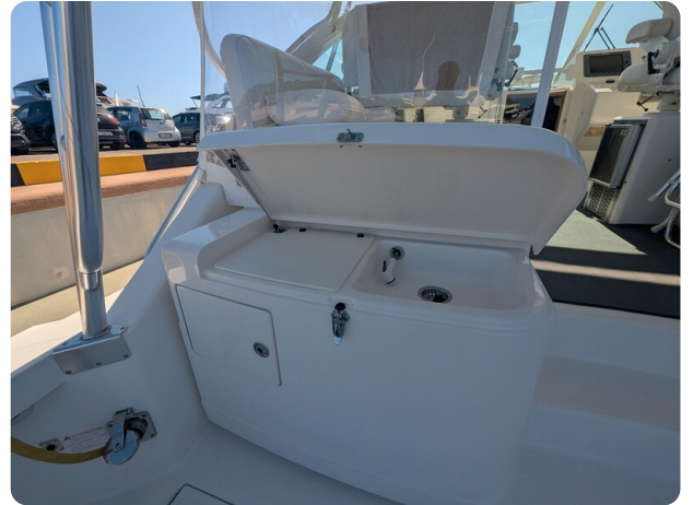
Cabo 38 Express cockpit sink