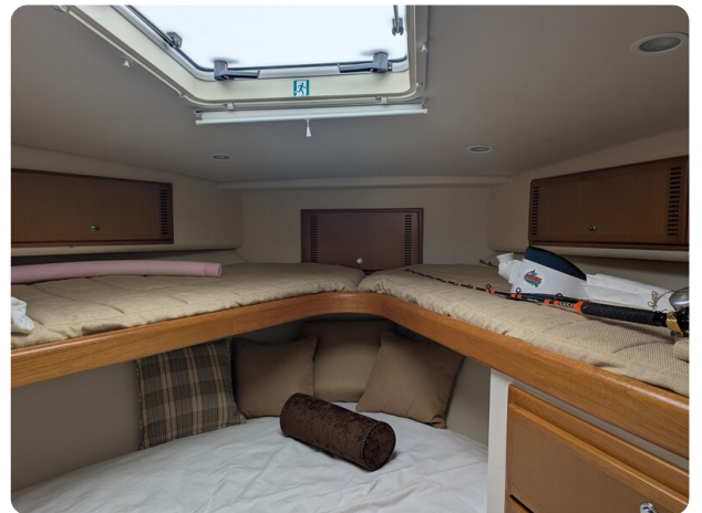
Cabo 38 Express cabin detail