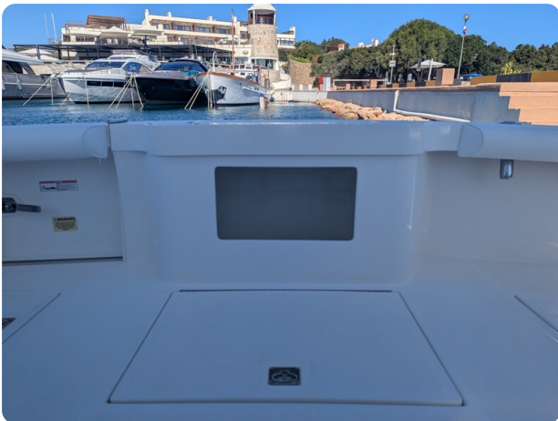
Cabo 38 Express live baitwell