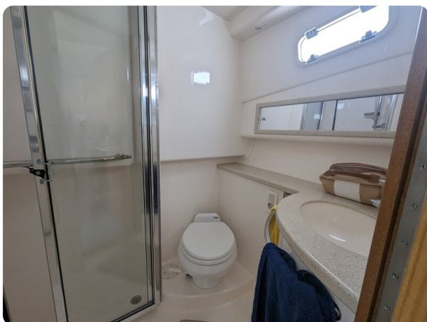
Cabo 38 Express bathroom