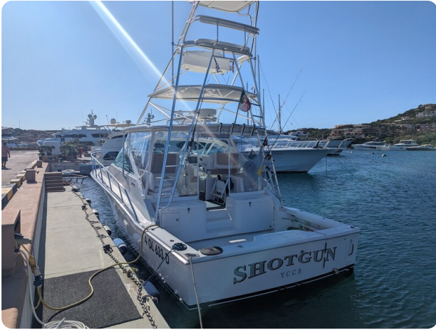
Cabo 38 Express stern view