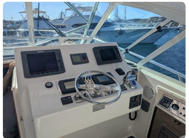
Cabo 38 Express helm