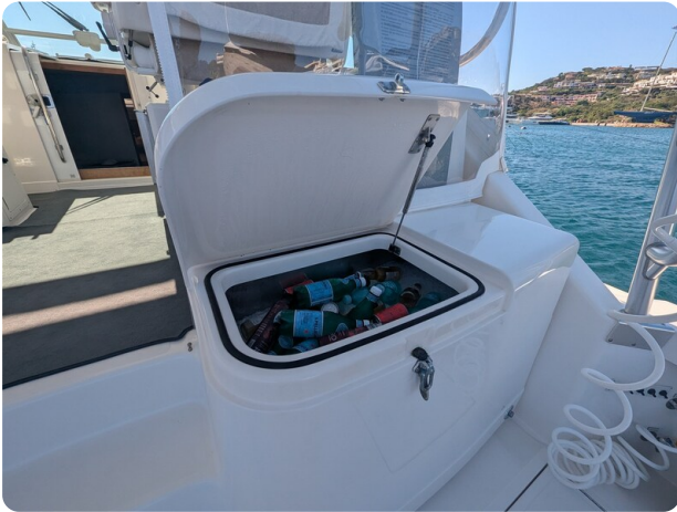
Cabo 38 Express cockpit icebox