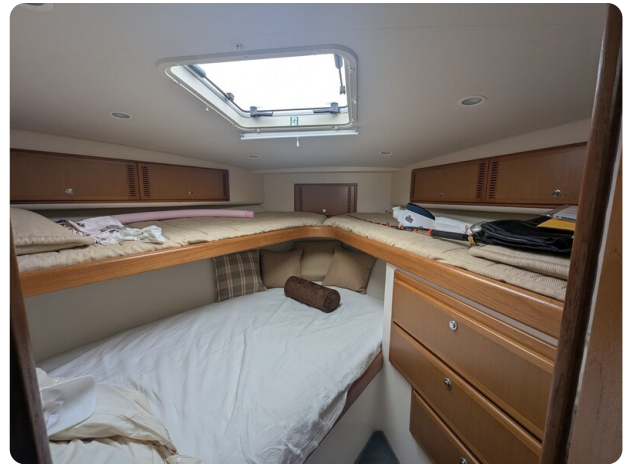
Cabo 38 Express cabin