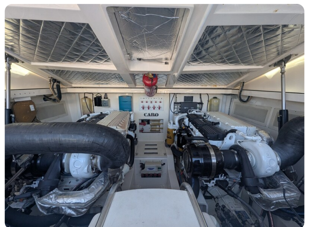
Cabo 38 Express engine room