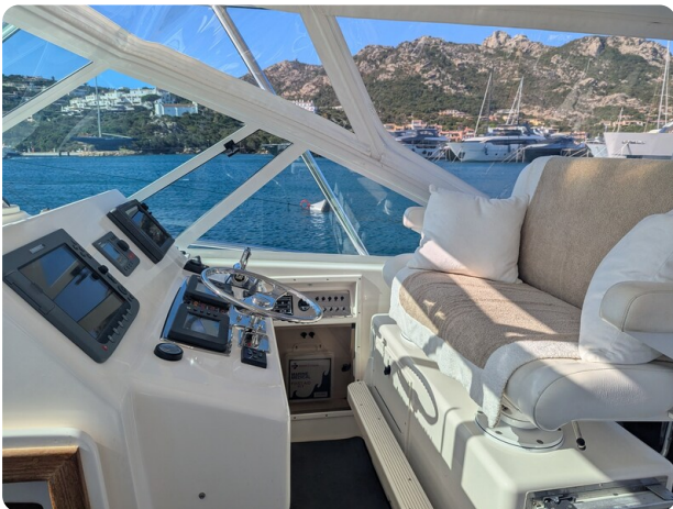
Cabo 38 Express helm station