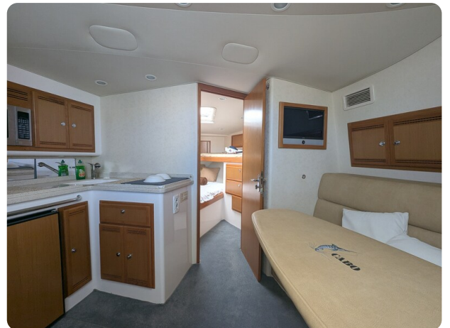
Cabo 38 Express interiors