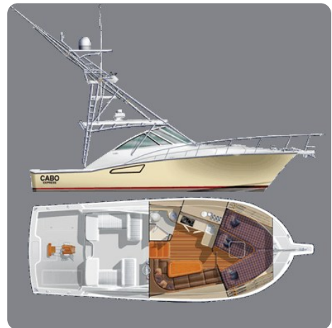
Cabo 38 Express layout