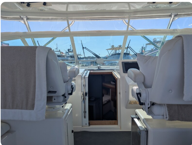
Cabo 38 Express upper cockpit