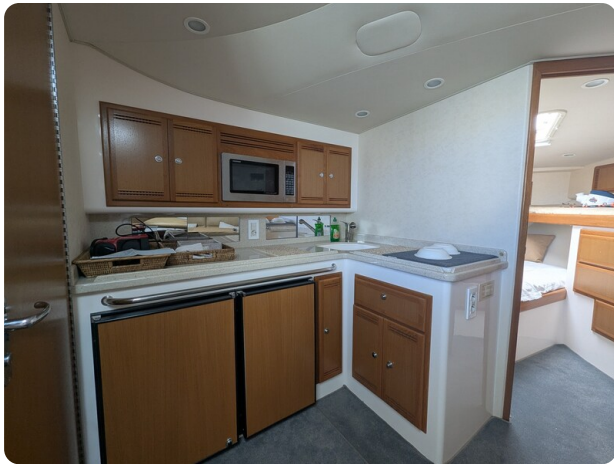
Cabo 38 Express galley