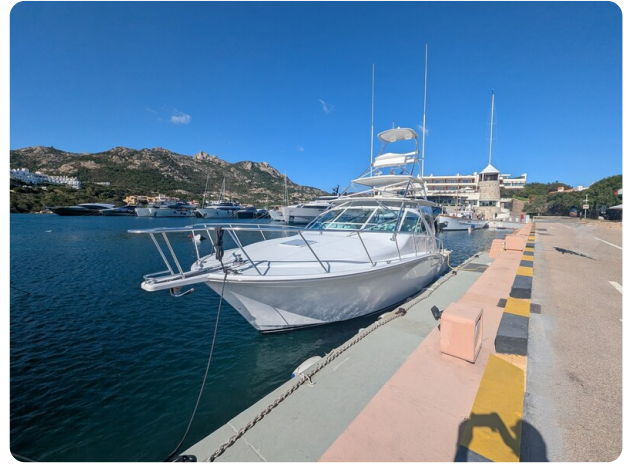
Cabo 38 Express bow view