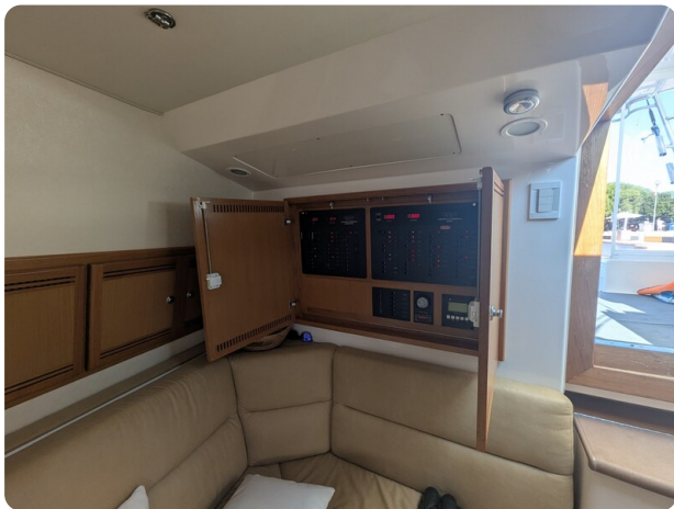
Cabo 38 Express salon detail