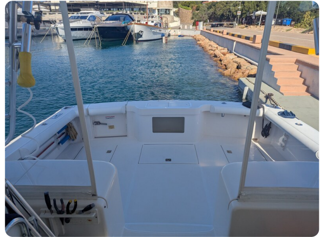
Cabo 38 Express cockpit view