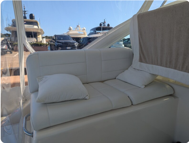
Cabo 38 Express cockpit lounge