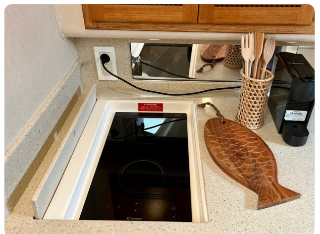
Cabo 32 Express cooktop