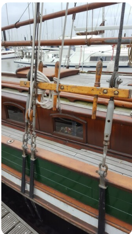
Bild3Bältjer Kutter msp625720 3