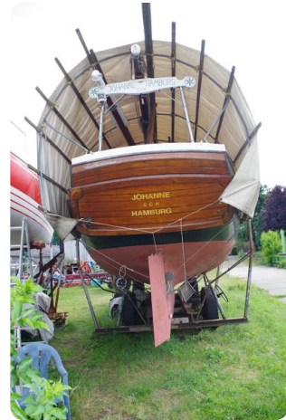
Bültjer Kutter msp625720 7