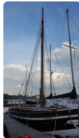
Bältjer Kutter msp625720 4