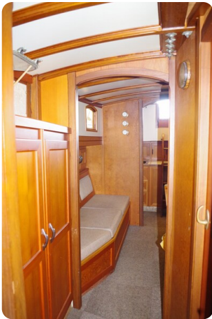
Bültjer Kutter msp625720 17