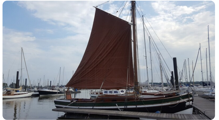
Bild1Bältjer Kutter msp625720 2