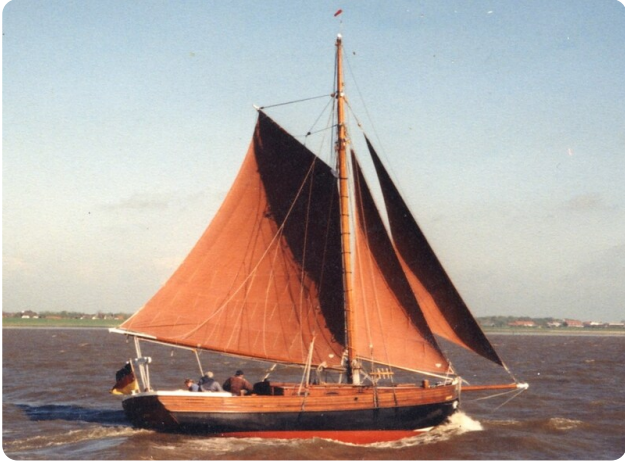
Bältjer Kutter msp625720 1