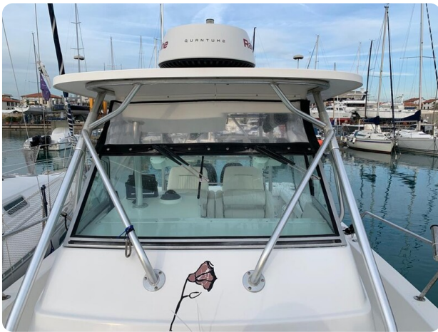
Boston 28 Outrage hard top detail