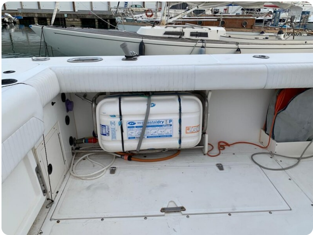
Boston 28 Outrage cockpit details