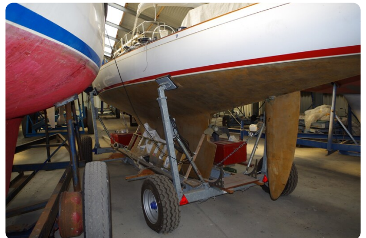
Schärenkreuzer FLORIAN 17