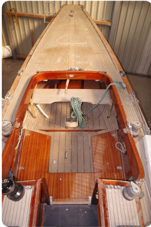
Schärenkreuzer FLORIAN 1