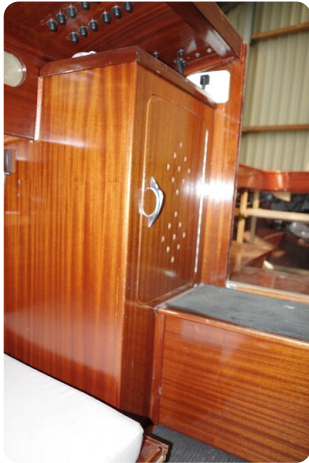
Schärenkreuzer FLORIAN 54