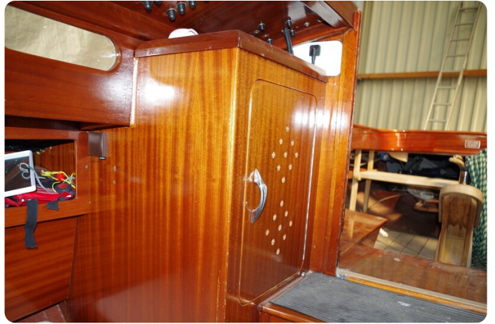
Schärenkreuzer FLORIAN 53