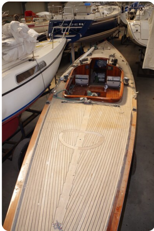
Schärenkreuzer FLORIAN 21