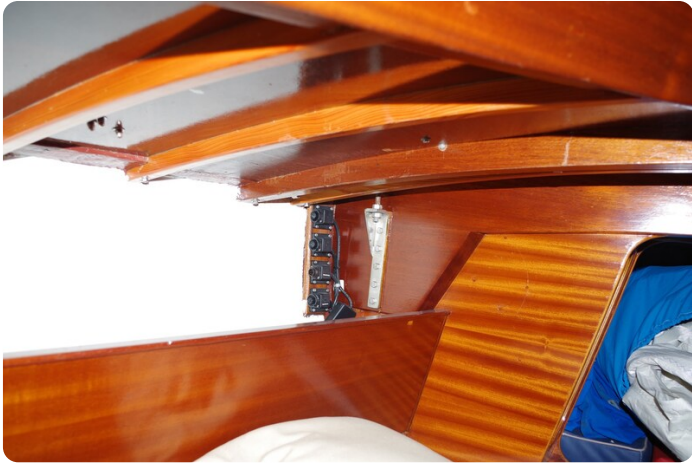
Schärenkreuzer FLORIAN 50