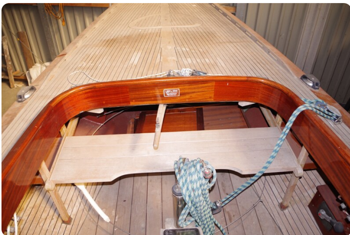
Schärenkreuzer FLORIAN 29