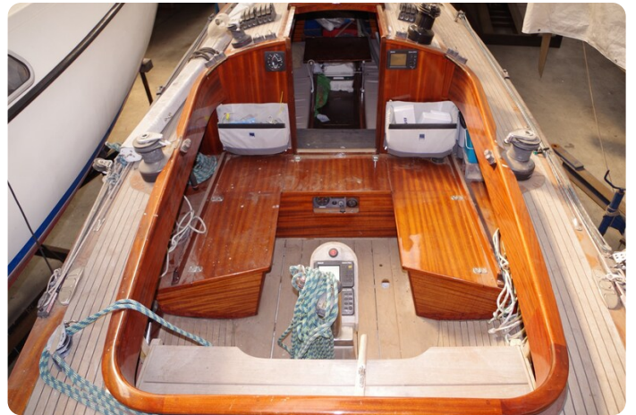
Schärenkreuzer FLORIAN 24