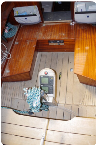
Schärenkreuzer FLORIAN 27