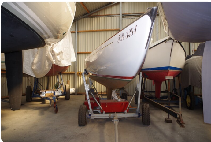
Schärenkreuzer FLORIAN 10