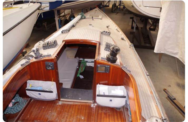
Schärenkreuzer FLORIAN 28