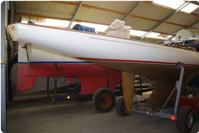
Schärenkreuzer FLORIAN 13