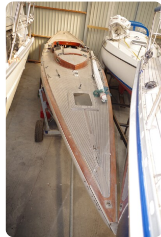
Schärenkreuzer FLORIAN 4