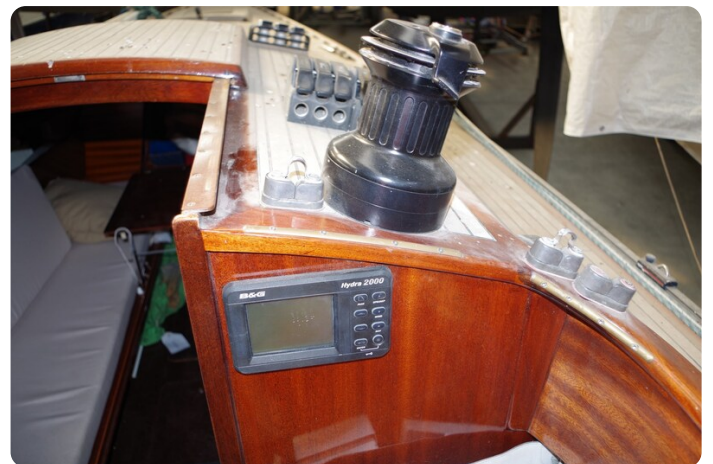
Schärenkreuzer FLORIAN 35