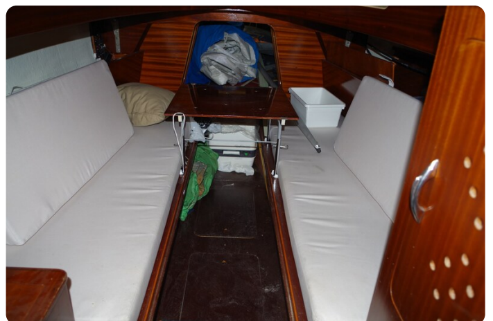
Schärenkreuzer FLORIAN 44