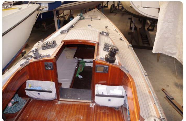
Schärenkreuzer FLORIAN 28