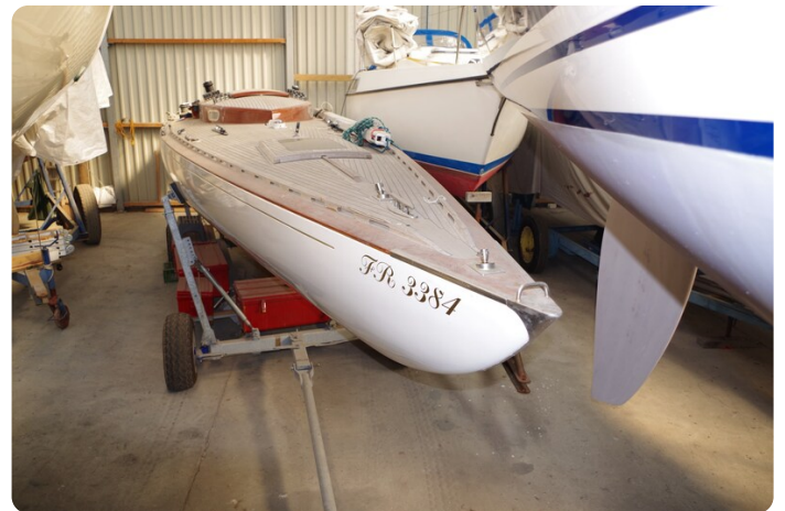
Schärenkreuzer FLORIAN 2