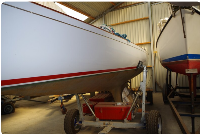
Schärenkreuzer FLORIAN 12