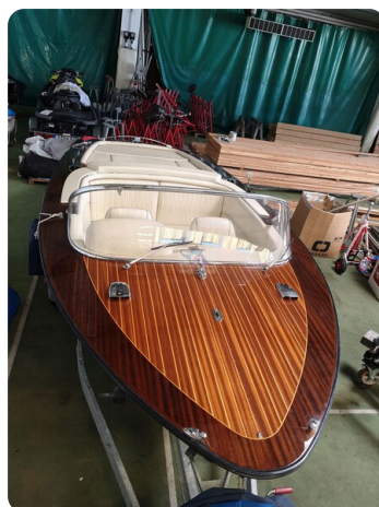
Boesch 590 Cabrio Deluxe CARPE DIEM 34