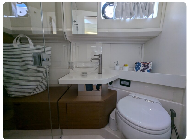
Bluegame 42 bathroom