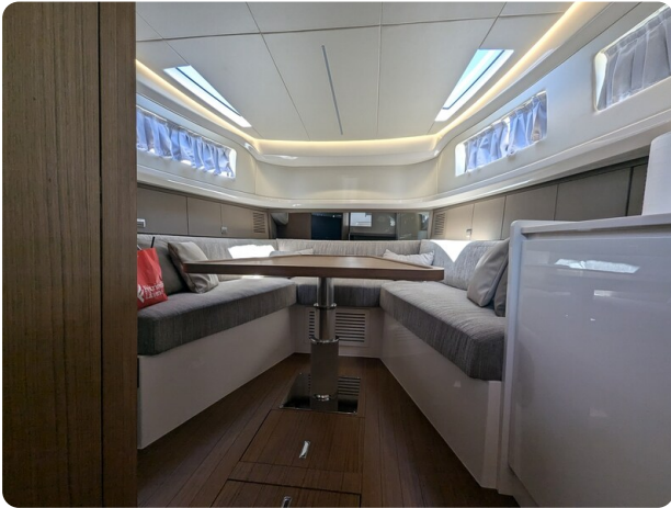
Bluegame 42 conv. dinette