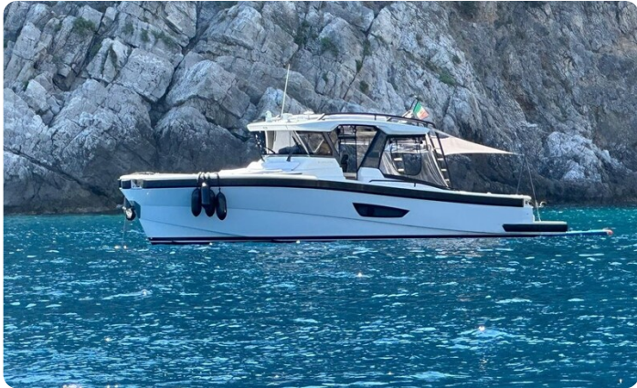
Bluegame 42 profile anchored 2