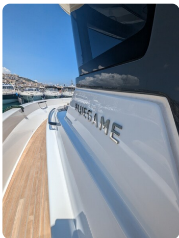
Bluegame 42 sideways detail