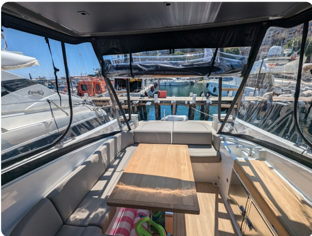
Bluegame 42 cockpit dinette