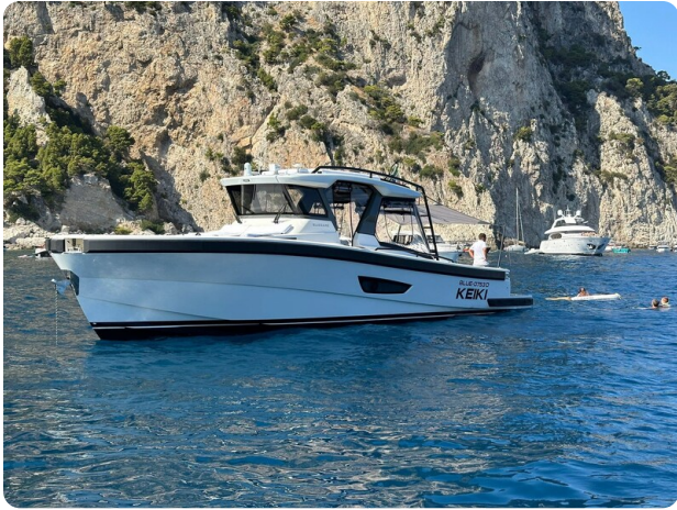
Bluegame 42 bow profile