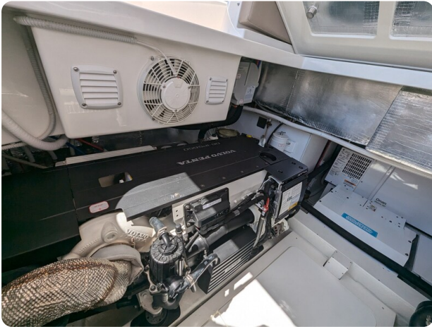
Bluegame 42 port engine