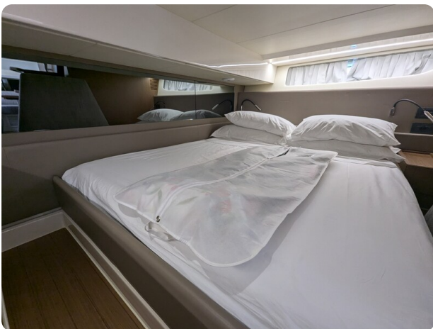
Bluegame 42 aft cabin