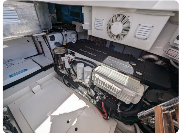
Bluegame 42 stbd engine