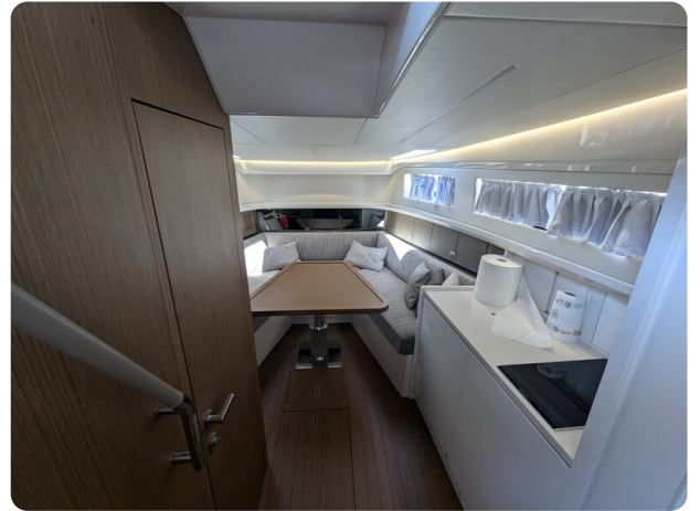
Bluegame 42 interiors