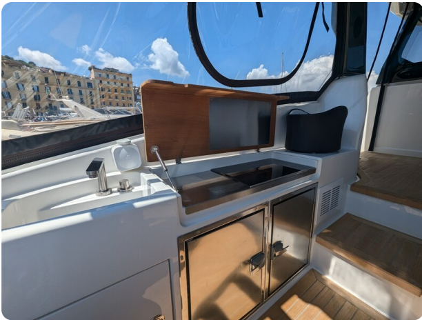
Bluegame 42 cockpit galley