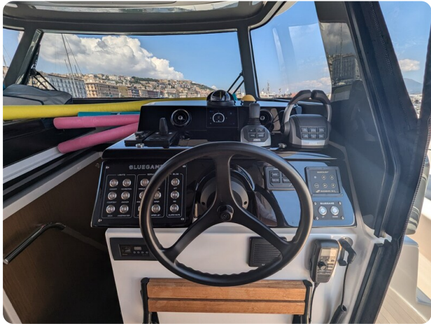
Bluegame 42 helm station