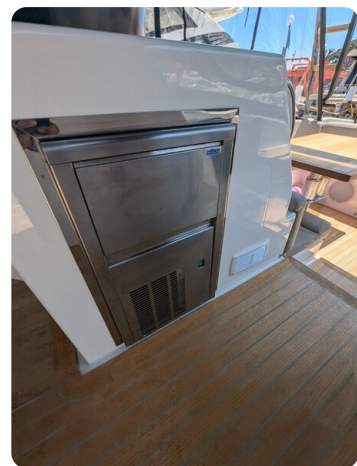
Bluegame 42 cockpit ice maker