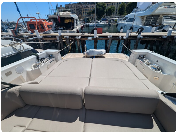
Bluegame 42 cockpit sunpad