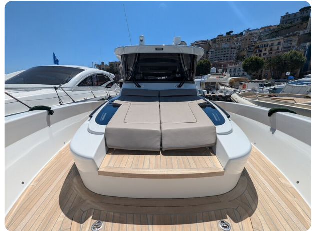
Bluegame 42 bow deck