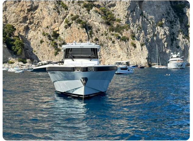
Bluegame 42 bow