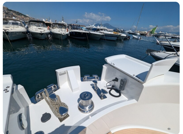
Bluegame 42 windlass detail