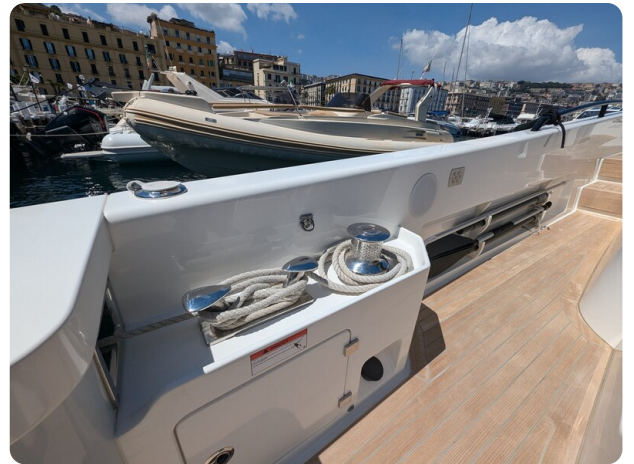
Bluegame 42 cockpit winches