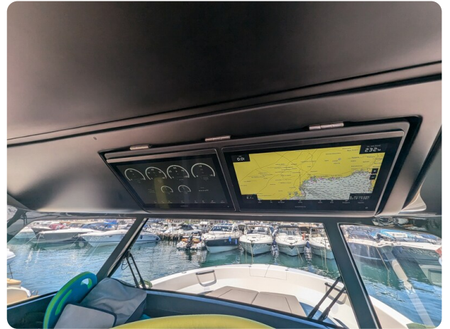
Bluegame 42 electronics