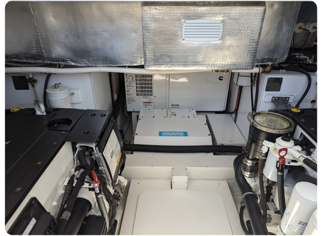
Bluegame 42 Onan generator