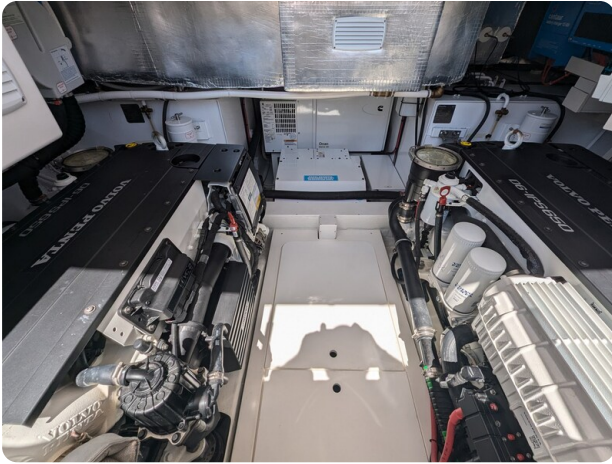
Bluegame 42 engine room