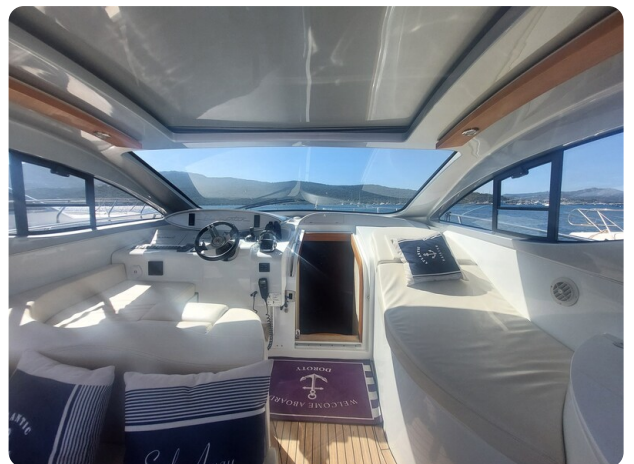
MBM Blu Martin