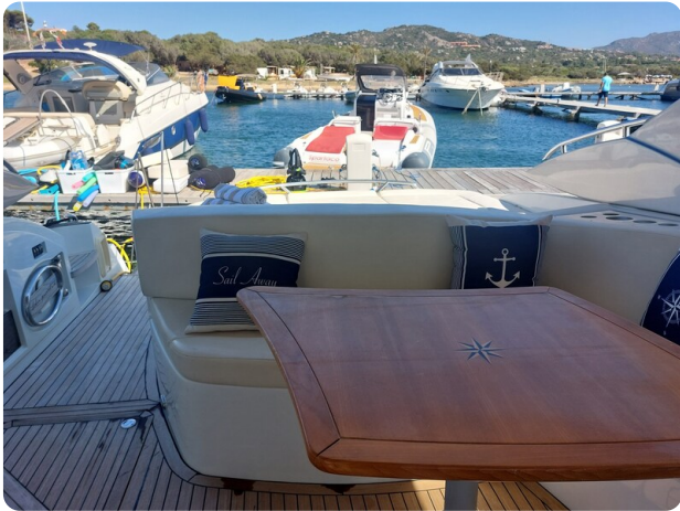
MBM Blu Martin