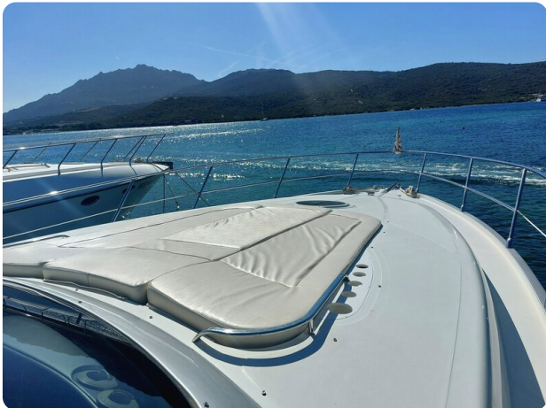
MBM Blu Martin