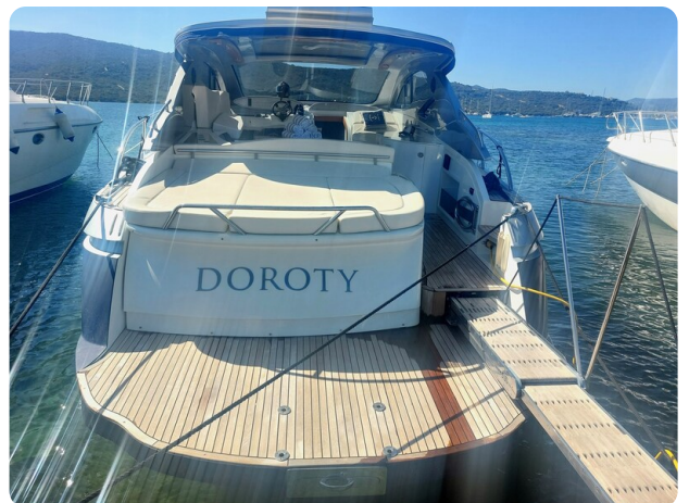
MBM Blu Martin