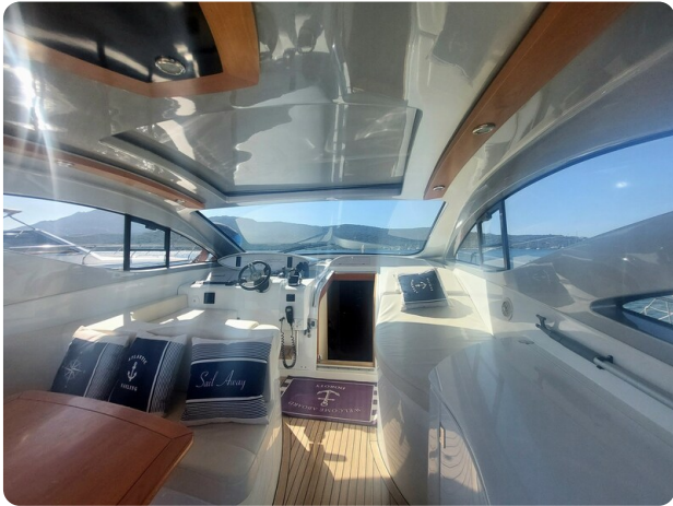
MBM Blu Martin