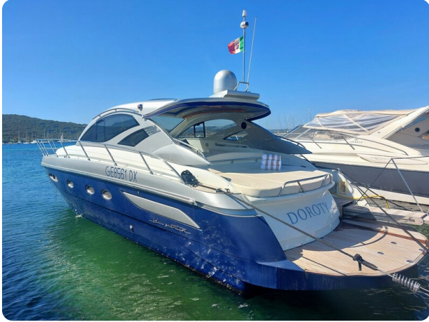
MBM Blu Martin