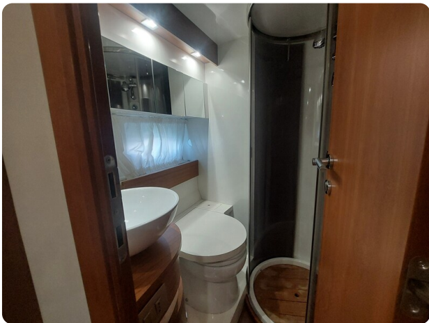
MBM Blu Martin