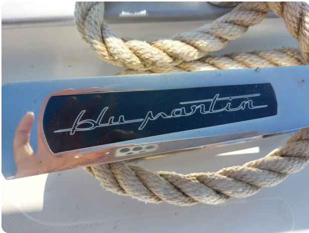
MBM Blu Martin