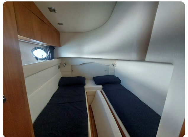
MBM Blu Martin