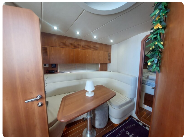
MBM Blu Martin