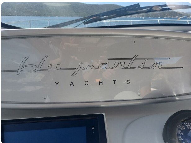
MBM Blu Martin