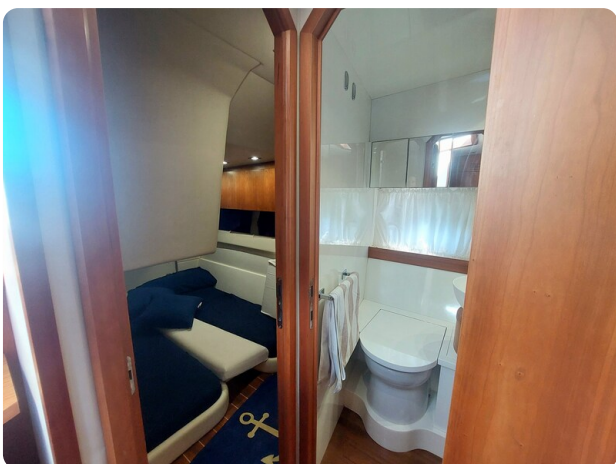
MBM Blu Martin