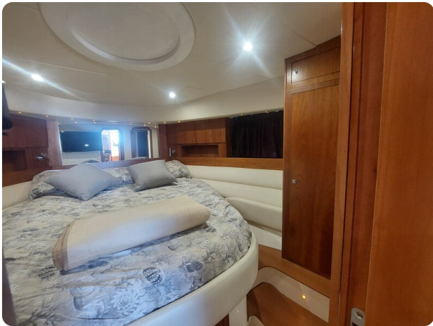
MBM Blu Martin