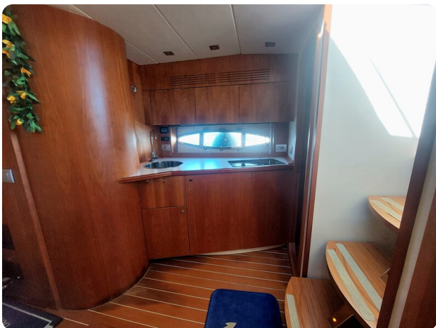
MBM Blu Martin