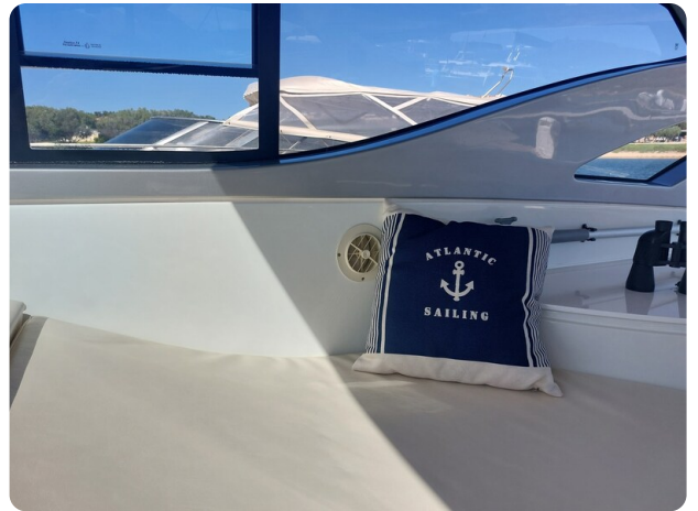
MBM Blu Martin