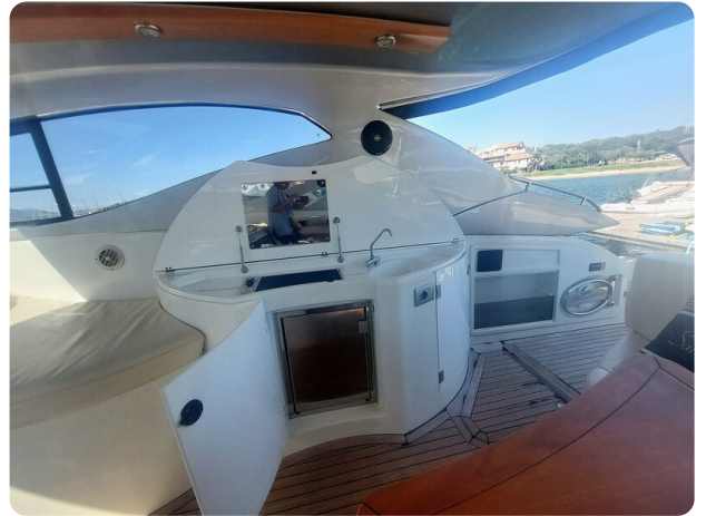
MBM Blu Martin