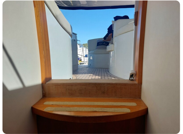
MBM Blu Martin