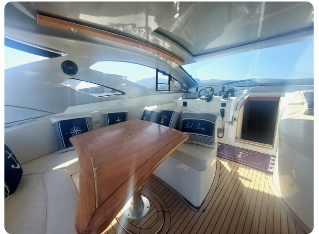
MBM Blu Martin