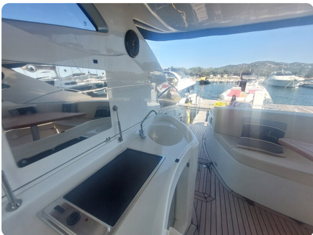
MBM Blu Martin