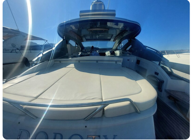
MBM Blu Martin