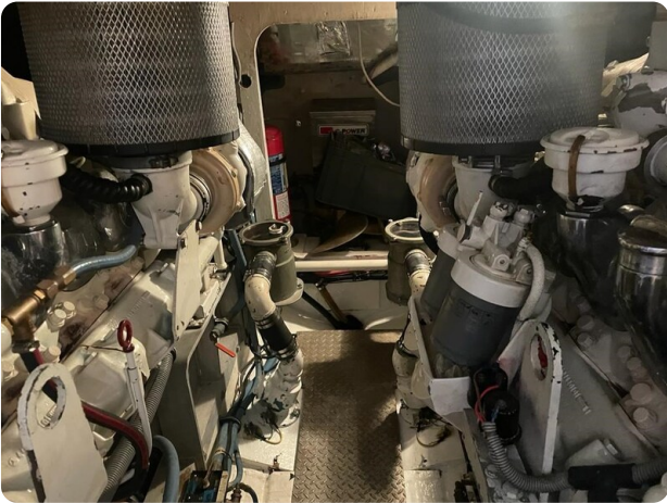
Bertram 43 Conv. engine room