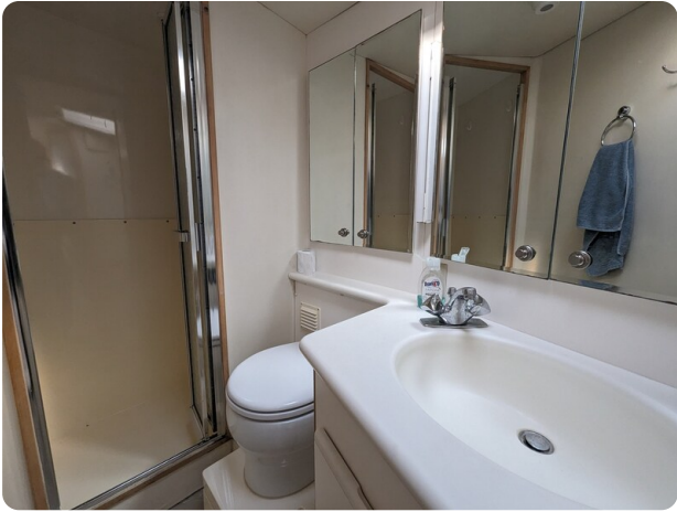
Bertram 43 Conv. master bathroom