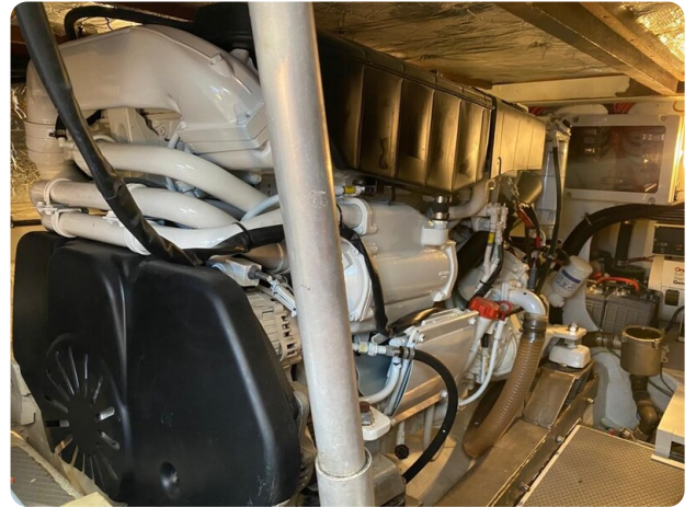
{1} engine detail