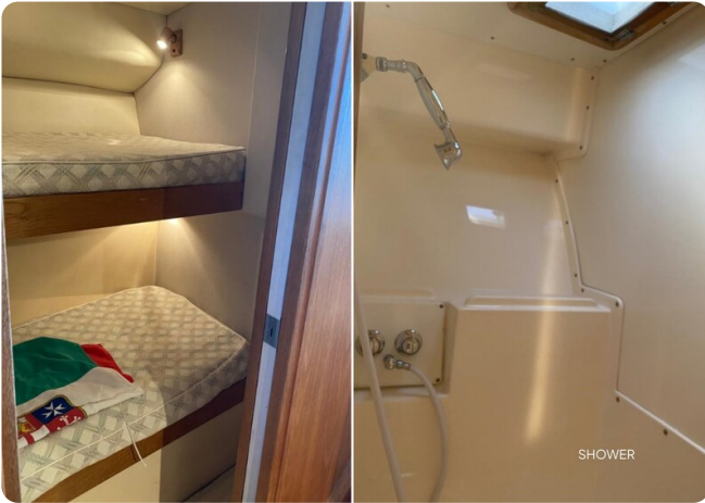
{1} guest cabin details