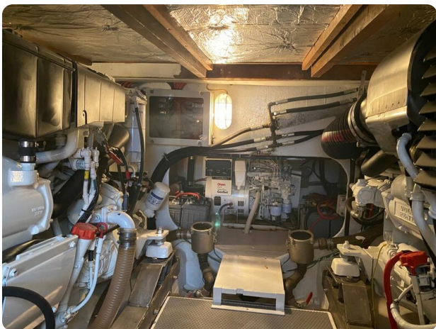
{1} engine room