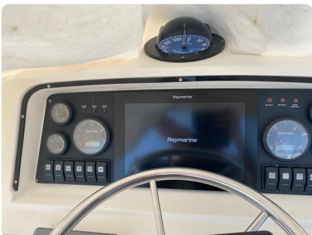
Bertram 37, electronics