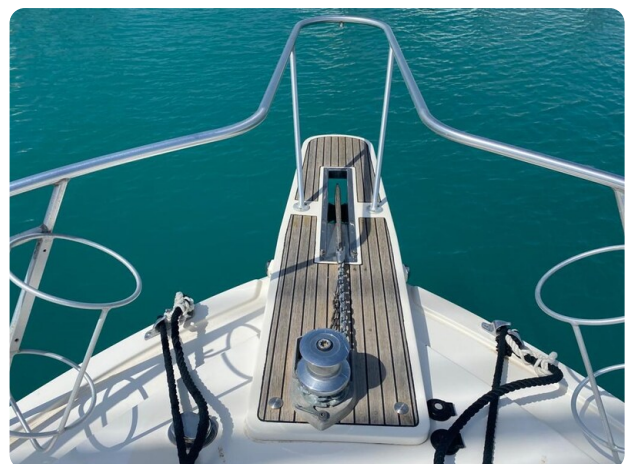
Bertram 37, bow pulpit