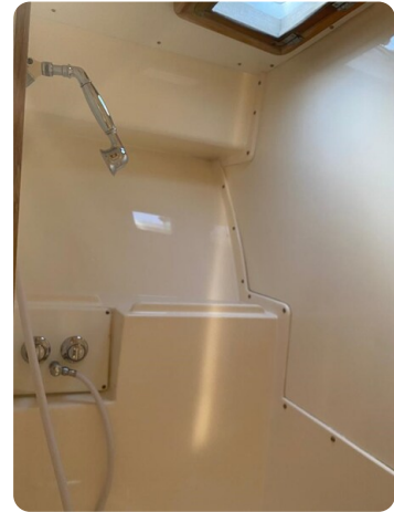
Bertram 37, shower