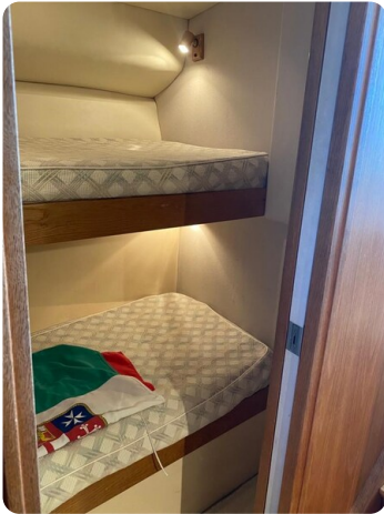
Bertram 37, guest cabin details