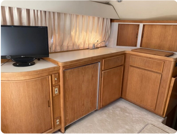
Bertram 37, galley view