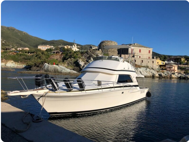
Bertram 37, bow profile