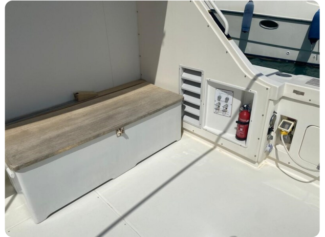
Bertram 37, cockpit detail