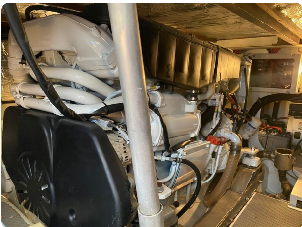
Bertram 37, engine detail