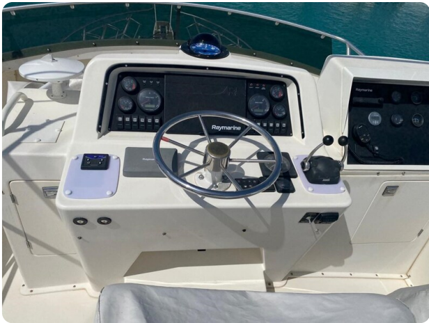
Bertram 37, Fly helm