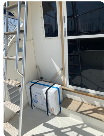
Bertram 37, cockpit details