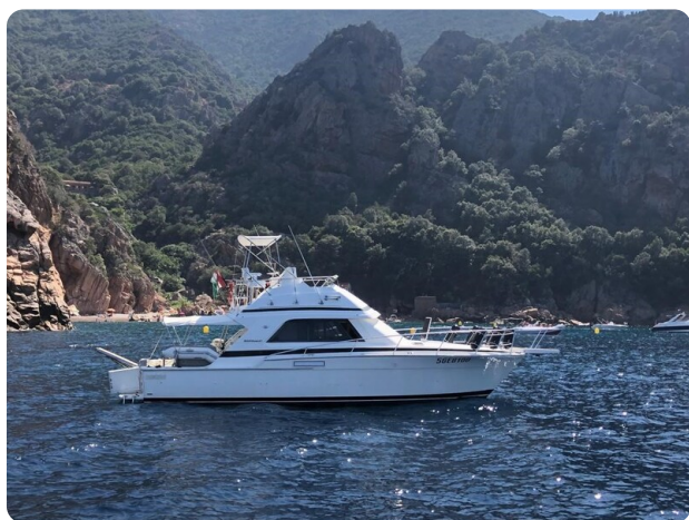
Bertram 37, profile