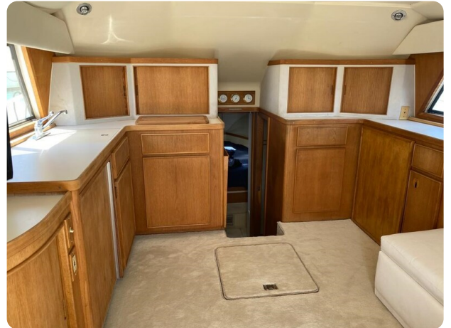
Bertram 37, salon