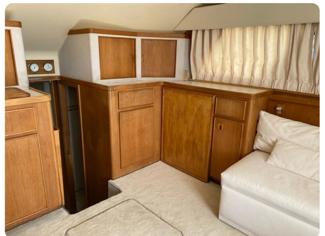
Bertram 37, salon detail