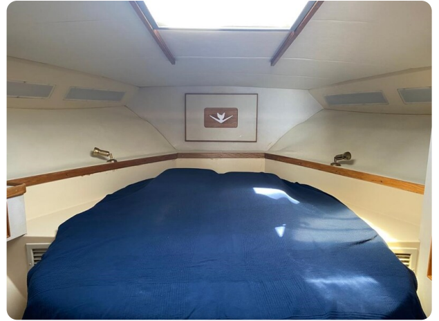
Bertram 37, cabin