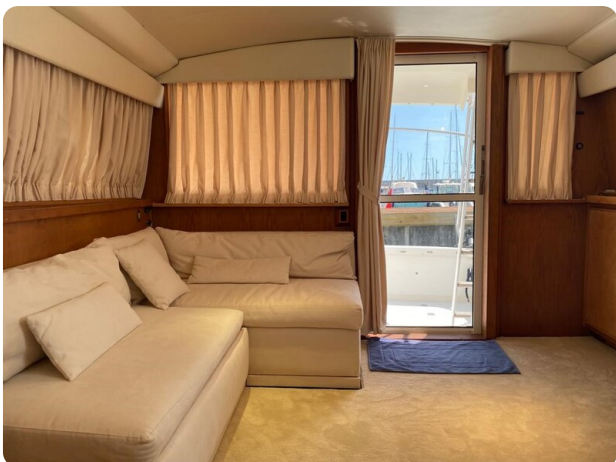
Bertram 37, salon to aft