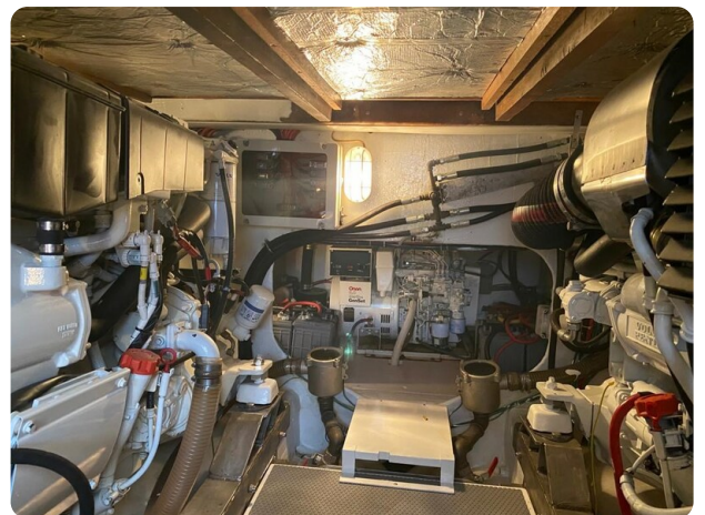
Bertram 37, engine room