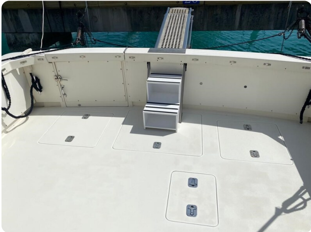
Bertram 37, aft cockpit