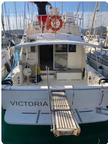
Bertram 37, aft view