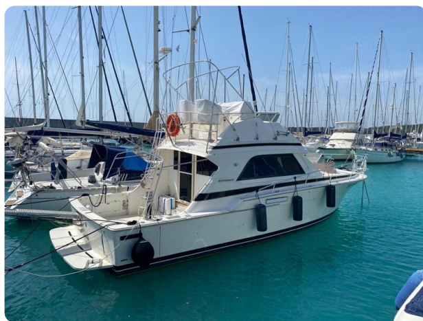
Bertram 37, moored