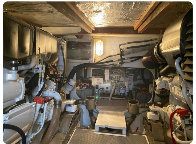
Bertram 37, engine room