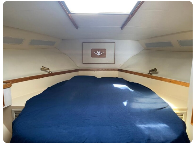
Bertram 37, cabin