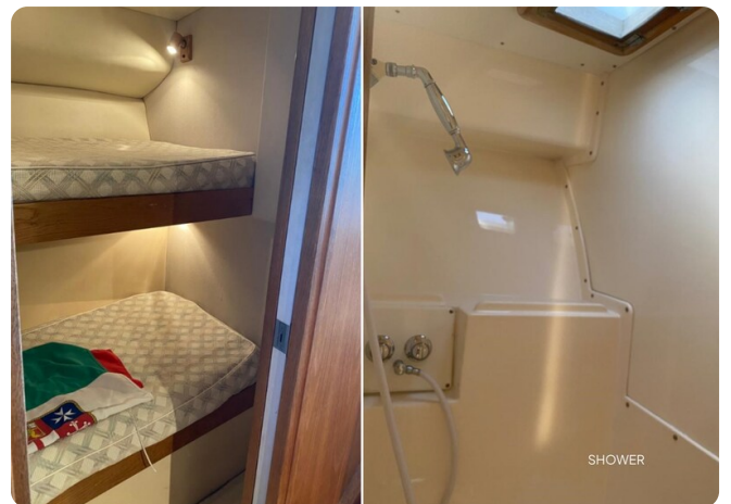
{1} guest cabin details