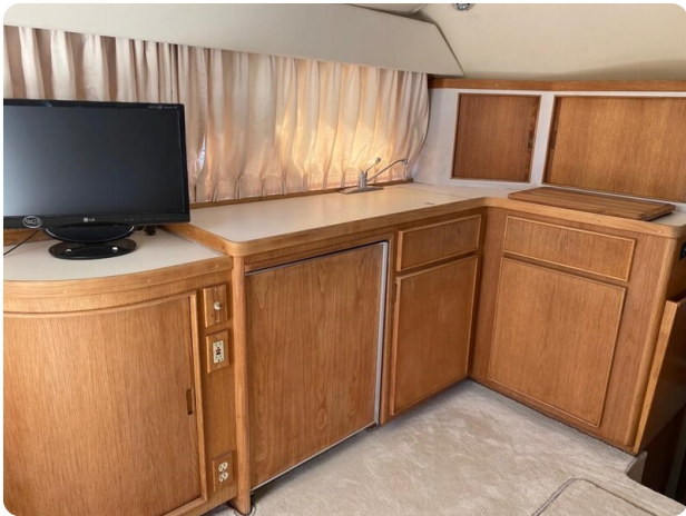
Bertram 37, galley view