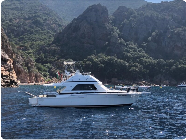
Bertram 37, profile