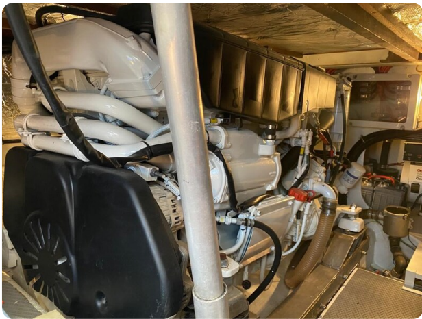
Bertram 37, engine detail