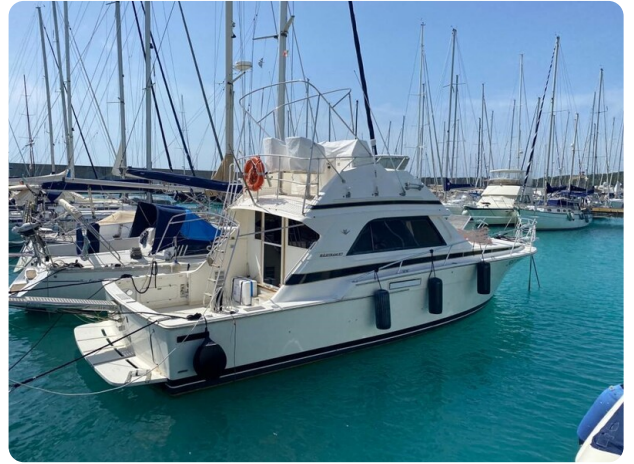
Bertram 37, moored