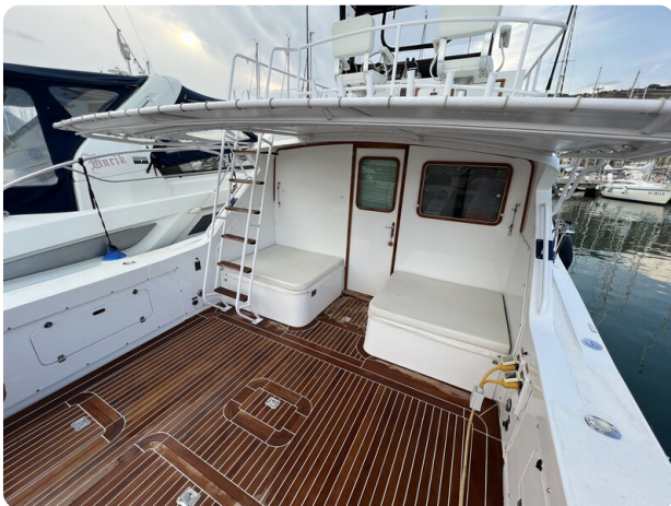
Bertram 33 Sport Fisherman2