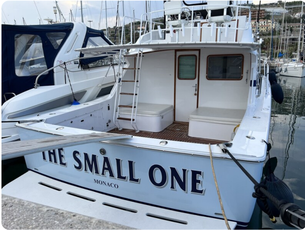
Bertram 33 Sport Fisherman