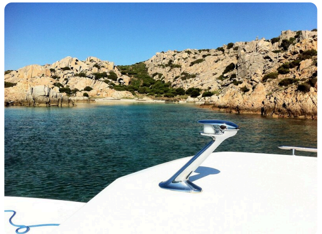
Bertram 25 MKII Hard Top detail