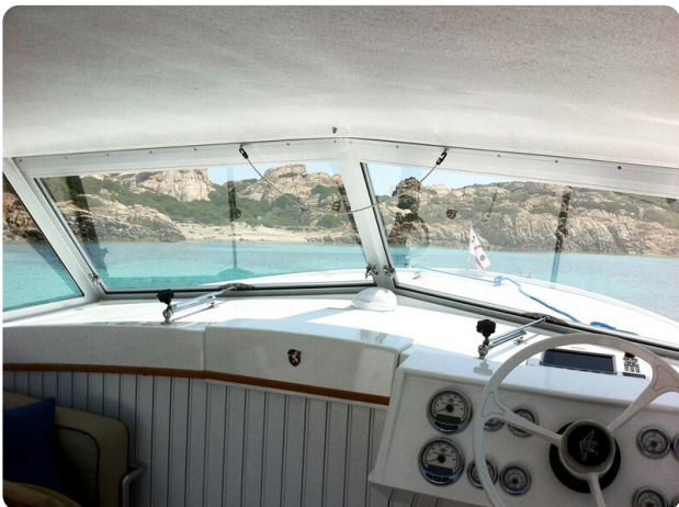
Bertram 25 MKII Hard Top detail 5