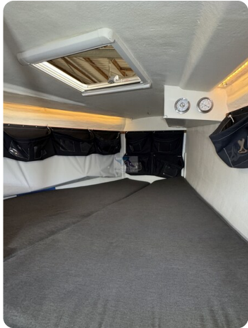
Bente 24 MUGGEL 57