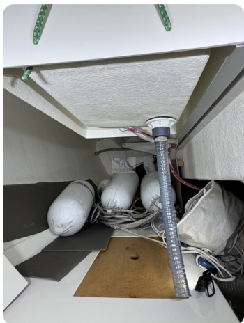
Bente 24 MUGGEL 53