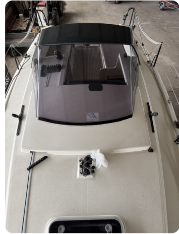
Bente 24 MUGGEL 27