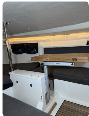
Bente 24 MUGGEL 49