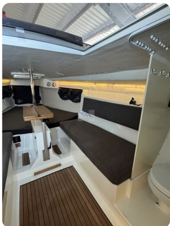
Bente 24 MUGGEL 45