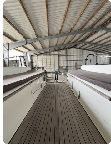
Bente 24 MUGGEL 25