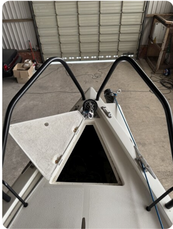
Bente 24 MUGGEL 28