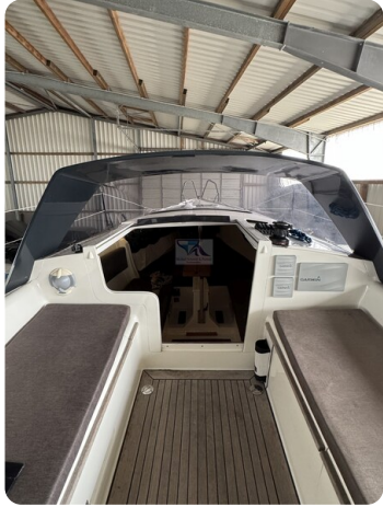
Bente 24 MUGGEL 15