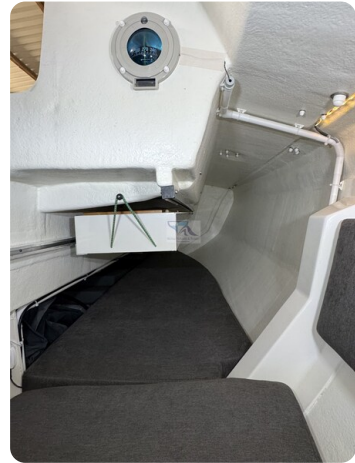
Bente 24 MUGGEL 52