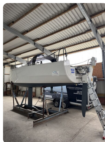
Bente 24 MUGGEL 3