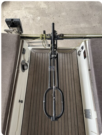
Bente 24 MUGGEL 16