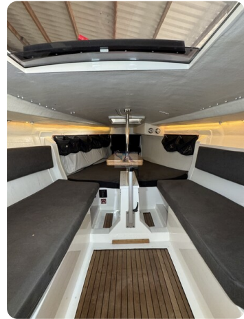
Bente 24 MUGGEL 47