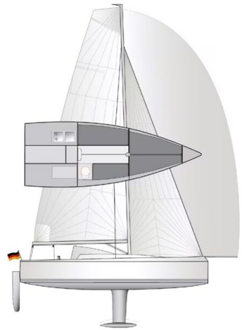
Bente 24- Layout