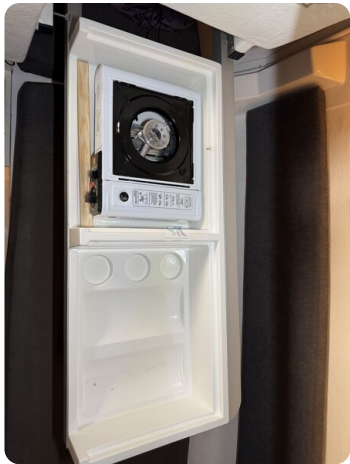
Bente 24 MUGGEL 31