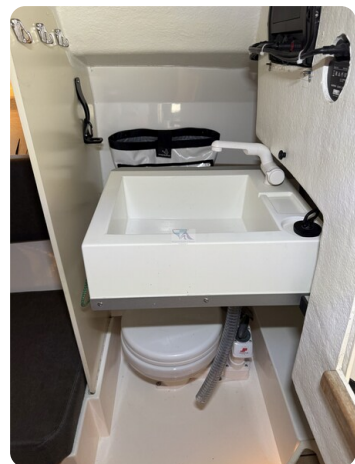
Bente 24 MUGGEL 33