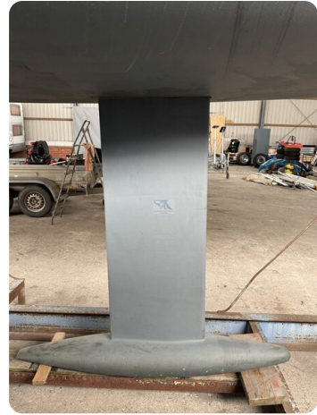
Bente 24 MUGGEL 7