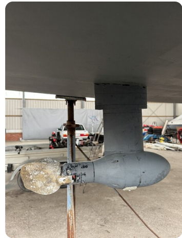
Bente 24 MUGGEL 5