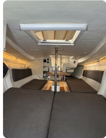
Bente 24 MUGGEL 56