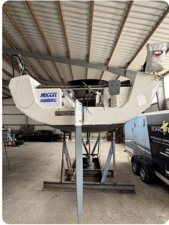
Bente 24 MUGGEL 4