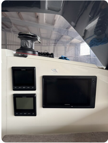
Bente 24 MUGGEL 21