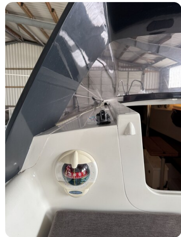
Bente 24 MUGGEL 18