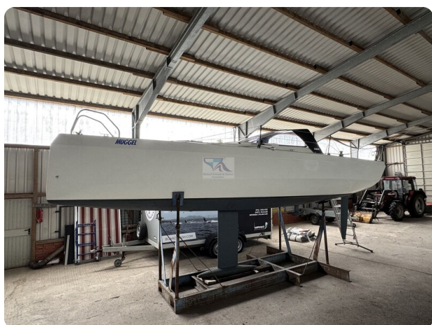
Bente 24 MUGGEL 13