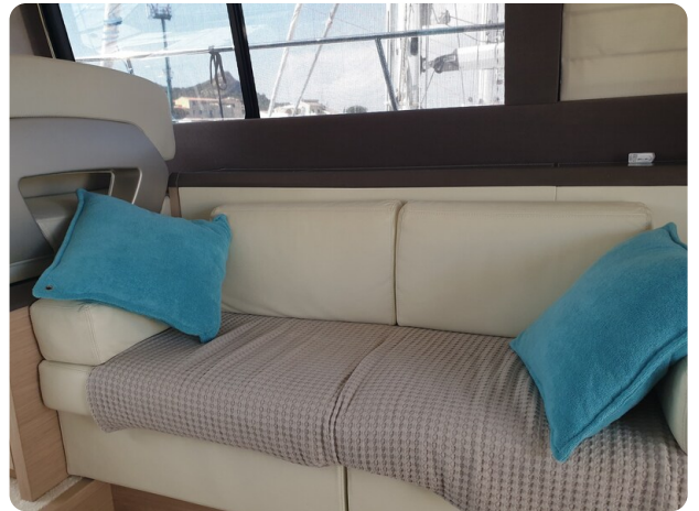
{1} Salon lounge