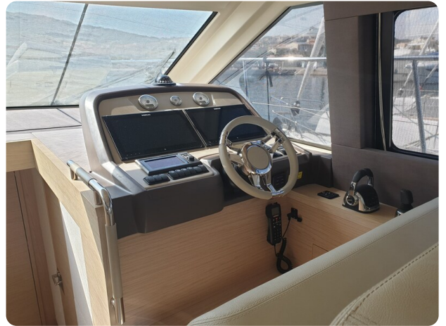
{1} Helm station