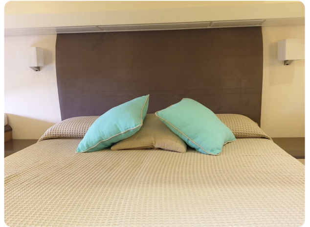
{1} Owner's cabin