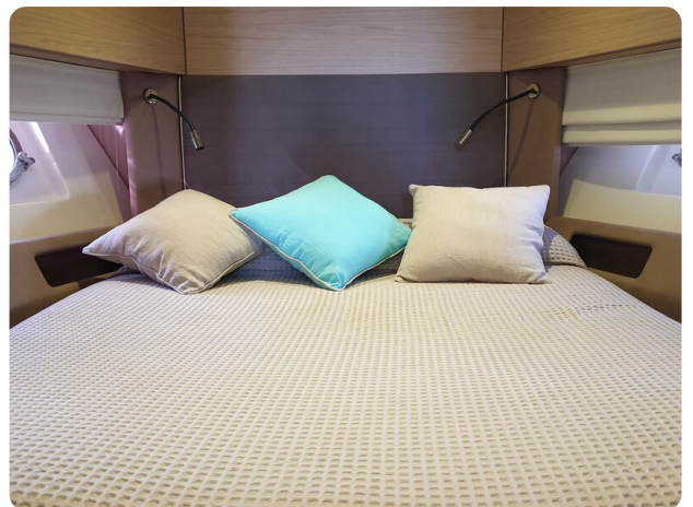
{1} Vip cabin