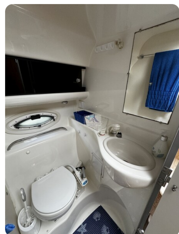
Bayliner 285 - MSP 25