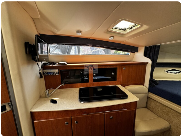
Bayliner 285 - MSP 8