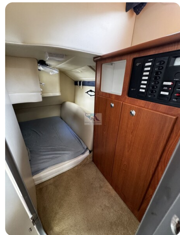
Bayliner 285 - MSP 18