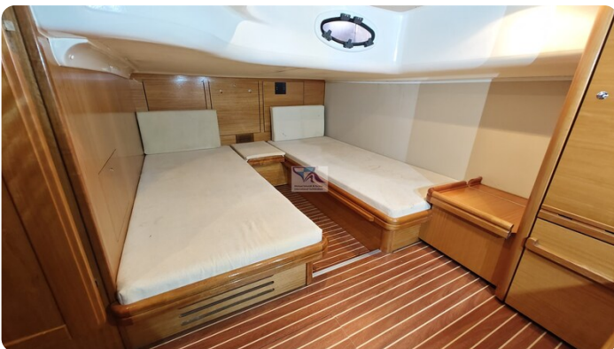
Bavaria 37 Sport msp793423 48