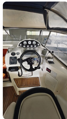
Bavaria 37 Sport msp793423 25