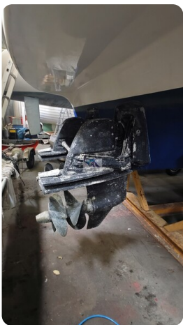
Bavaria 37 Sport msp793423 2