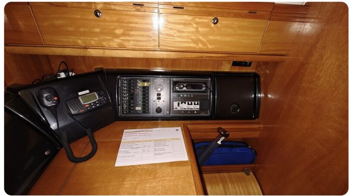
Bavaria 37 msp749314 16