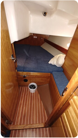
Bavaria 37 msp749314 20