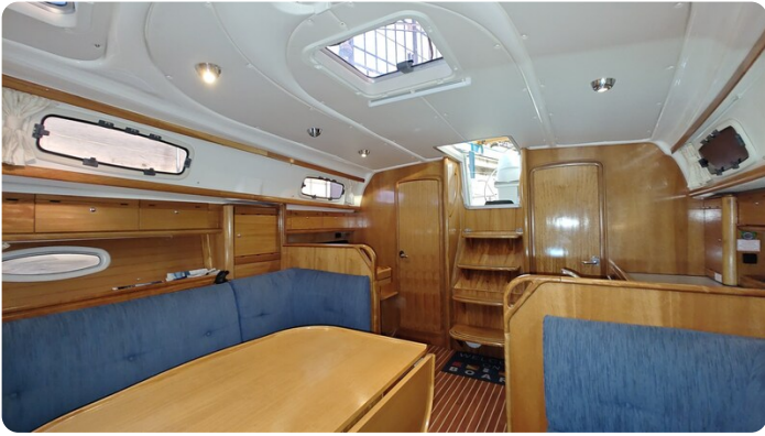
IBavaria 37 msp749314 22