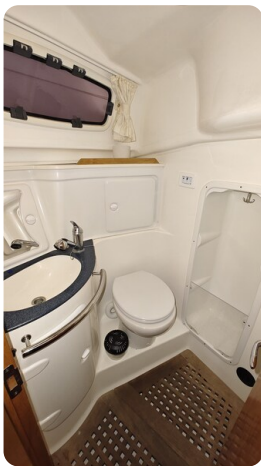
Bavaria 37 msp749314 17