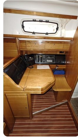
Bavaria 37 msp749314 21