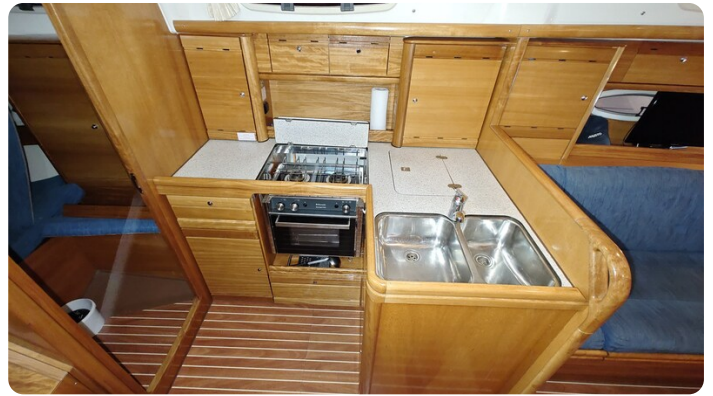
Bavaria 37 msp749314 14