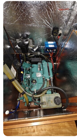
Bavaria 37 msp749314 23