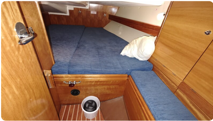
Bavaria 37 msp749314 15