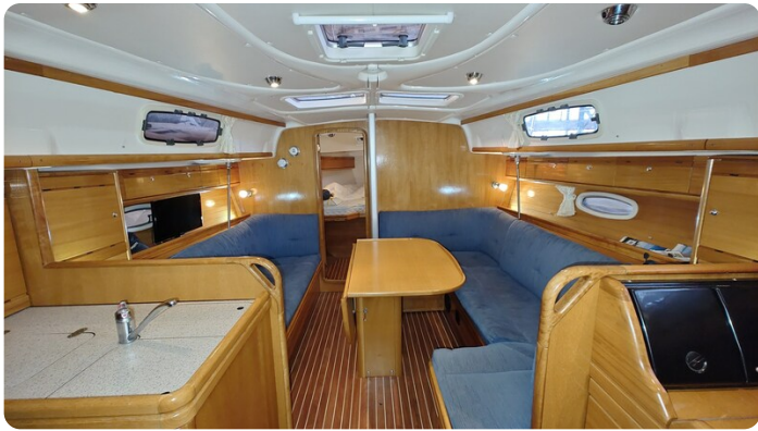
Bavaria 37 msp749314 13