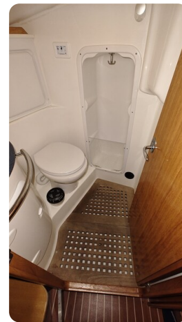
Bavaria 37 msp749314 18