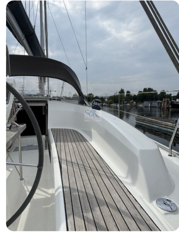
Bavaria 32 Cruiser HERON 57