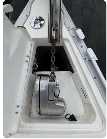
Bavaria 32 Cruiser HERON 68