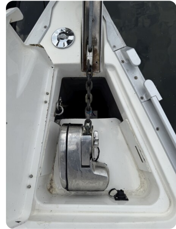
Bavaria 32 Cruiser HERON 68