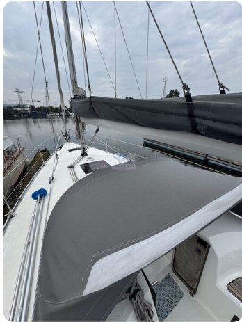
Bavaria 32 Cruiser HERON 61