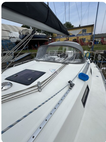
Bavaria 32 Cruiser HERON 63