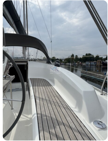
Bavaria 32 Cruiser HERON 57