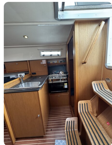
Bavaria 32 Cruiser HERON 40