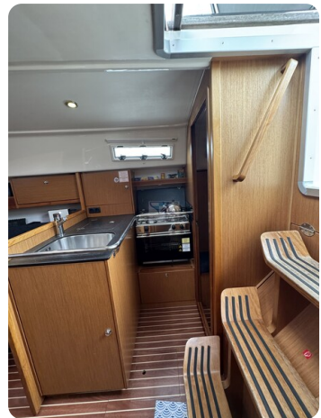
Bavaria 32 Cruiser HERON 40