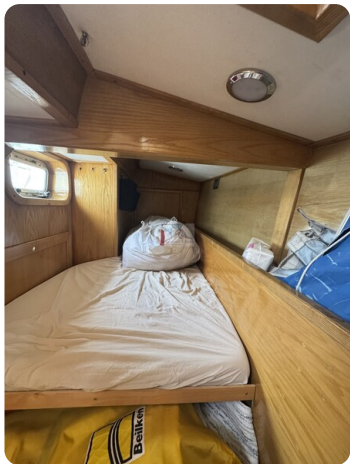
Baron 38 DER LETZTE BARON 68