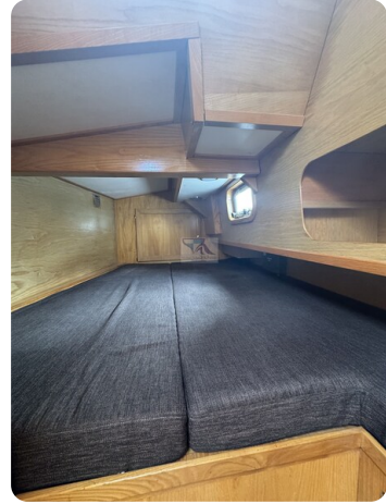
Baron 38 DER LETZTE BARON 61