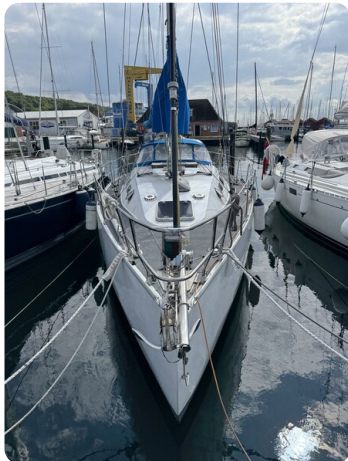
Baron 38 DER LETZTE BARON 23