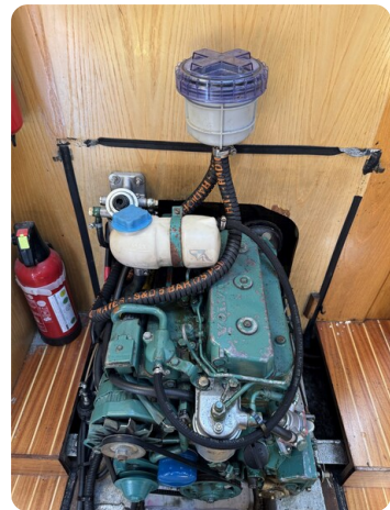
Baron 38 DER LETZTE BARON 6