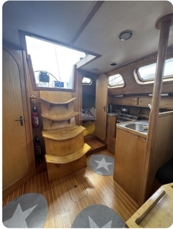
Baron 38 DER LETZTE BARON 51