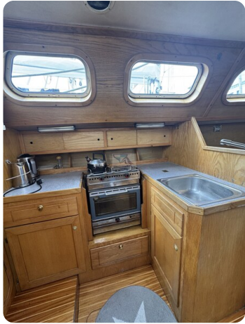
Baron 38 DER LETZTE BARON 71