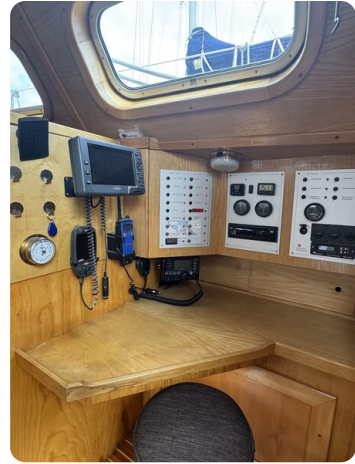
Baron 38 DER LETZTE BARON 75