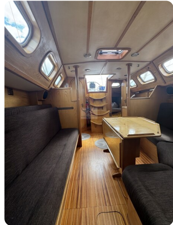
Baron 38 DER LETZTE BARON 53