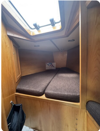
Baron 38 DER LETZTE BARON 55