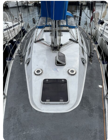
Baron 38 DER LETZTE BARON 30