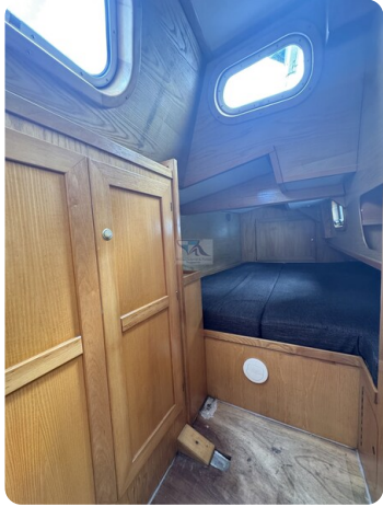
Baron 38 DER LETZTE BARON 62