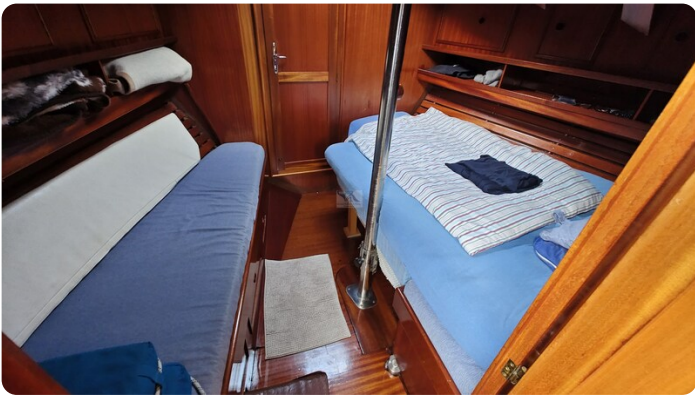
Baltika Decksalon SY 24