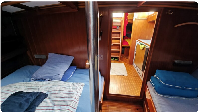
Baltika Decksalon SY 26