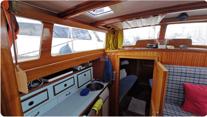
Baltika Decksalon SY 21