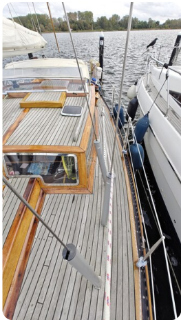
Baltika Decksalon SY 10