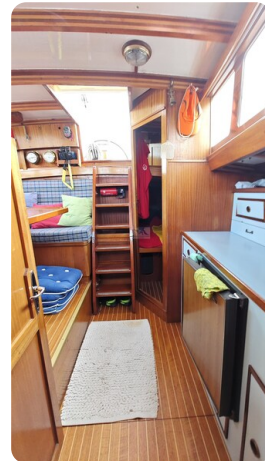
Baltika Decksalon SY 27