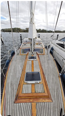
Baltika Decksalon SY 6