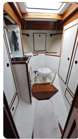
Baltika Decksalon SY 25