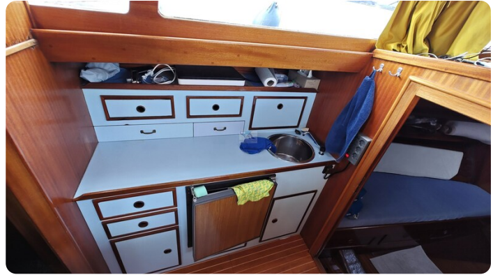
Baltika Decksalon SY 22