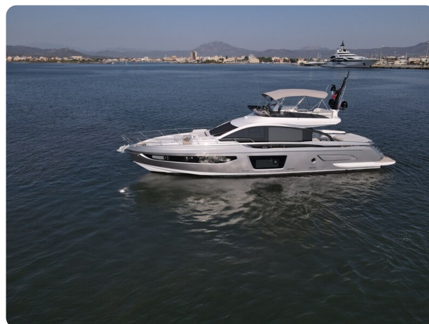
Azimut S7New aerial view