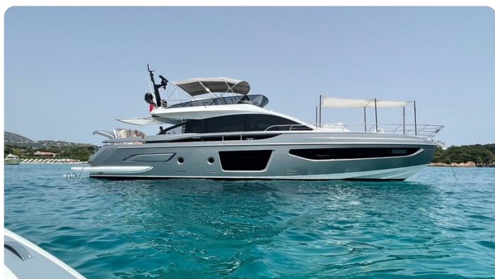
Azimut S7New anchored