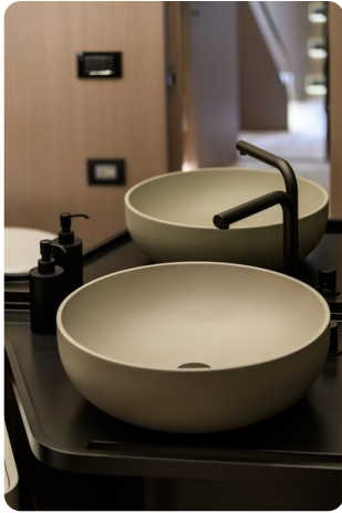
Azimut S7New bathroom detail