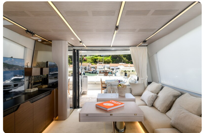
Azimut S7New salon to aft