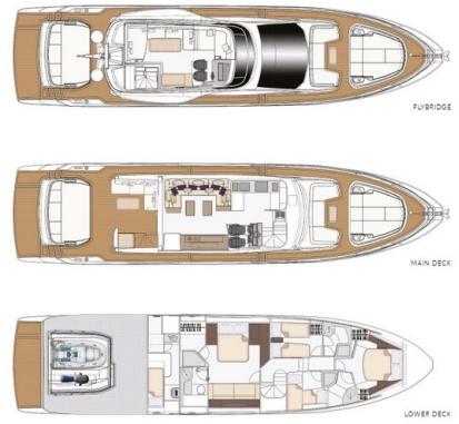
Azimut S7New, Layout