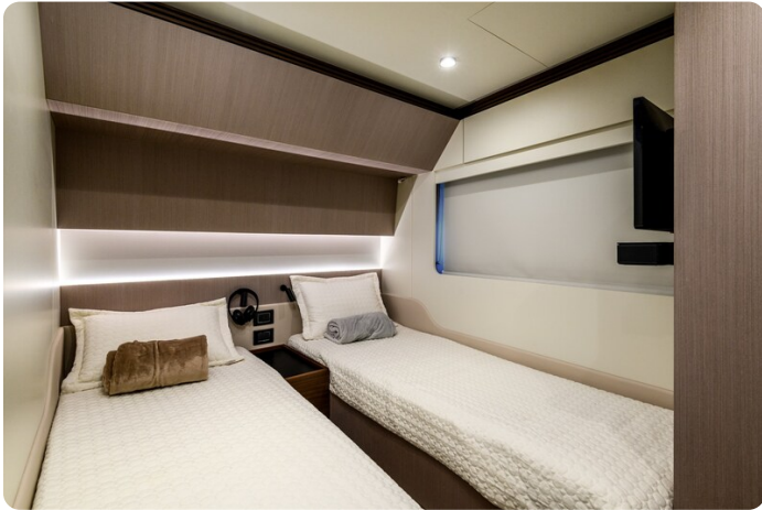
Azimut S7New guest cabin