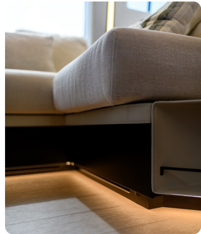
Azimut S7New salon detail