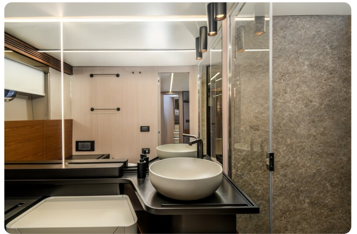
Azimut S7New ownr's bathroom