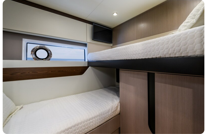
Azimut S7New L guest cabin