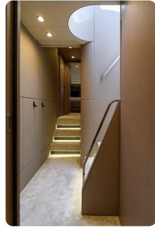
Azimut S7New companionway