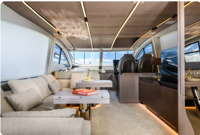
Azimut S7New salon to bow