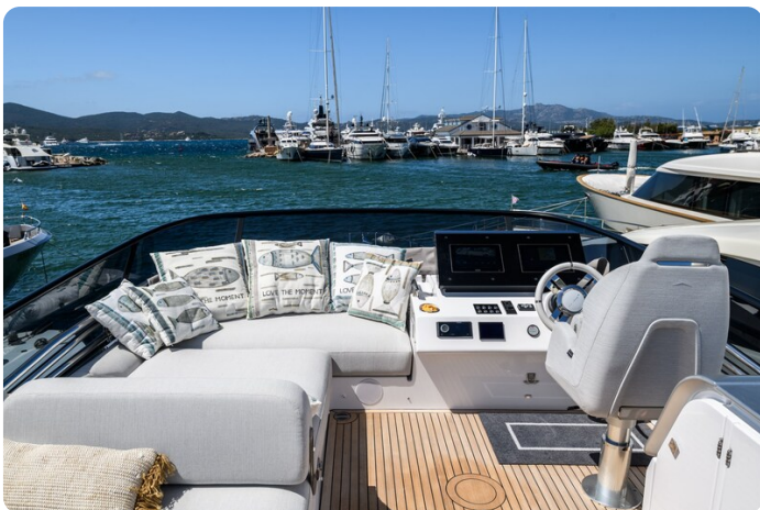
Azimut S7New, Flybridge helm station