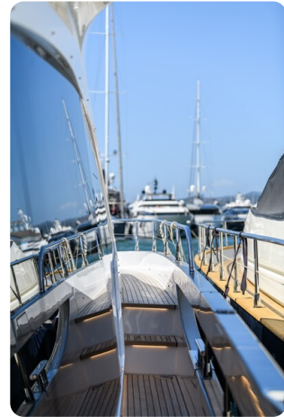
Azimut S7New sideways