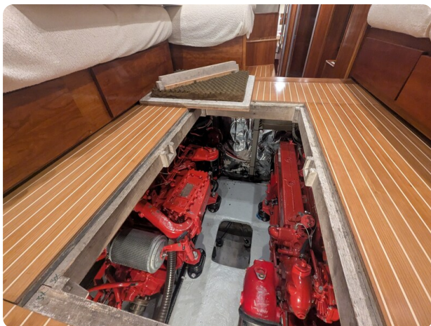
{1} Engine room