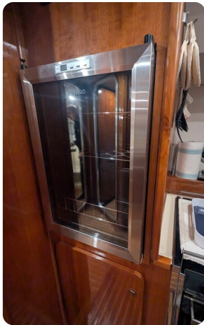
{1} Galley detail