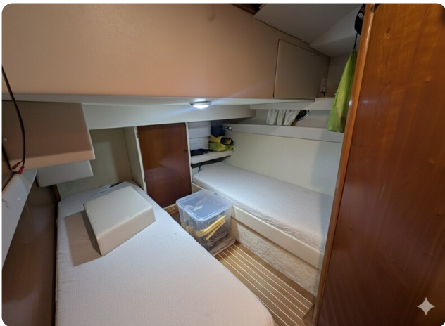
{1} Guest cabin