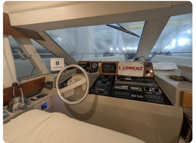
{1} Lower helm