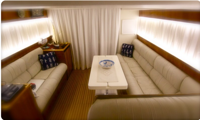
{1} Salon view