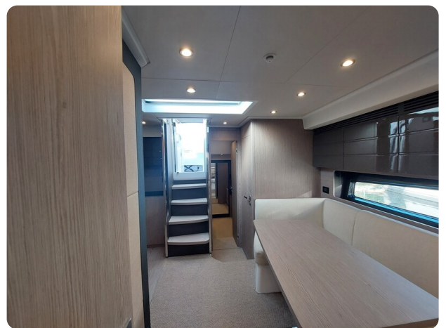
Azimut Atlantis 45 interiors