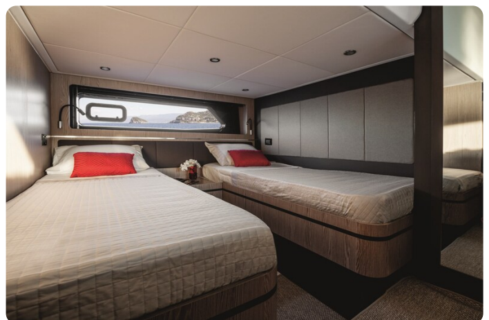
A45 Guest Cabin Twin beds