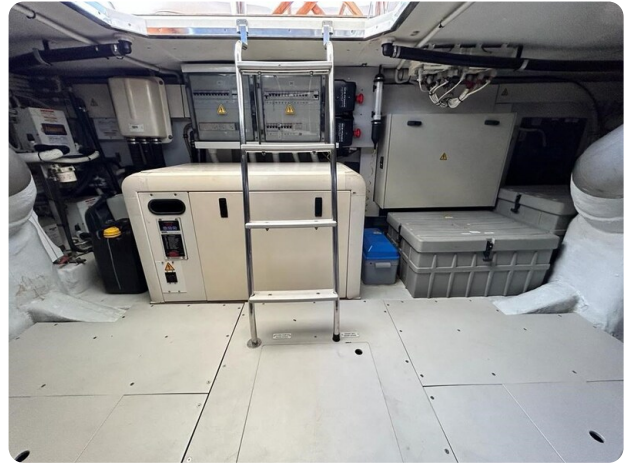
Az 62 Sala macchine - vista generatore