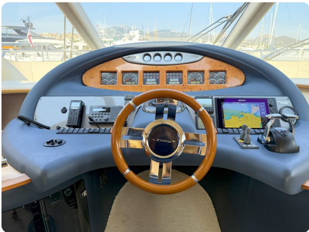
AZIMUT 55 helm station