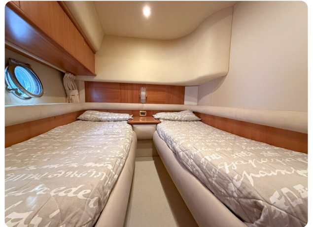
AZIMUT 55 Double cabin