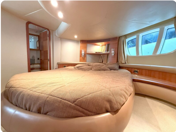
AZIMUT 55 Guest Cabin