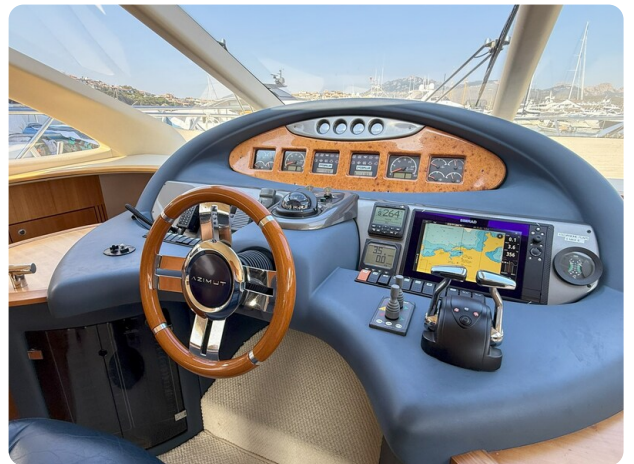
AZIMUT 55 Console detail