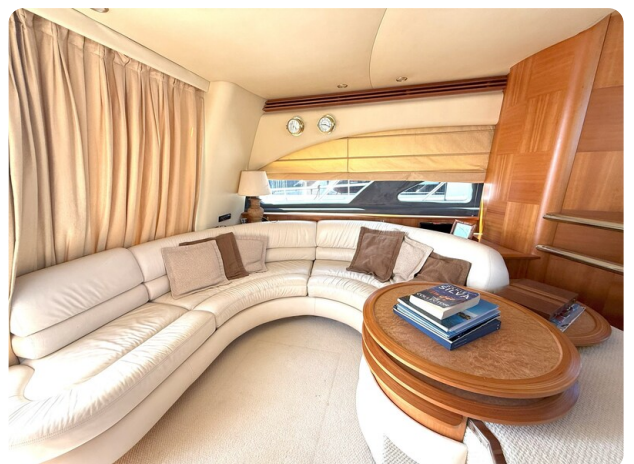
AZIMUT 55 Dinette