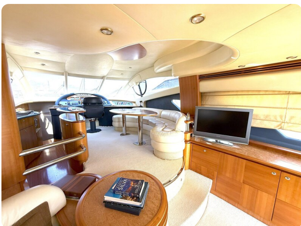
AZIMUT 55 Salon detail