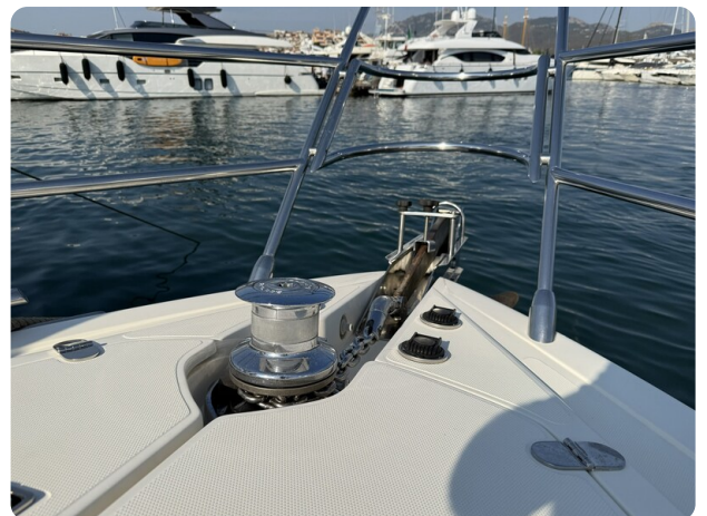
AZIMUT 55 Windlass