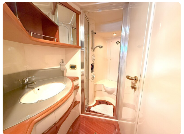
AZIMUT 55 Guest Head detail