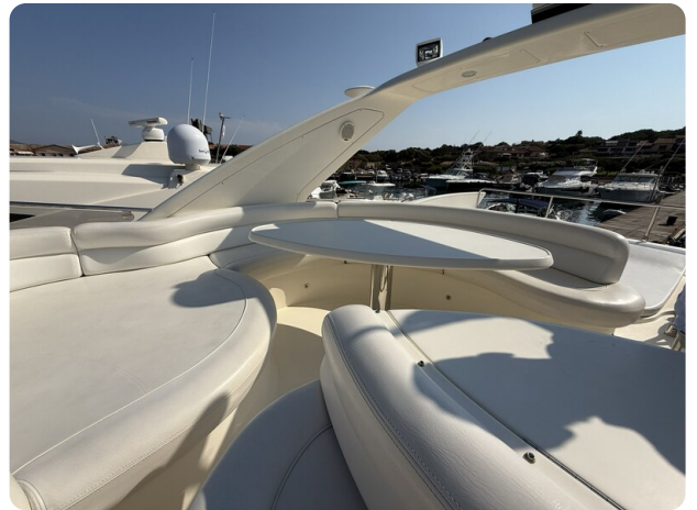
AZIMUT 55 Fly dinette