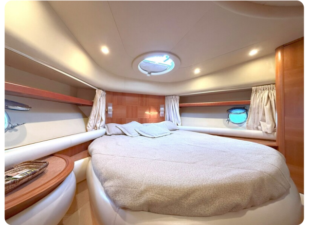
AZIMUT 55 Owner's cabin detail light