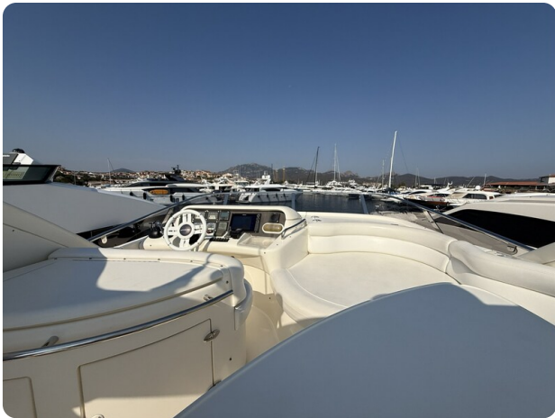
AZIMUT 55 Fly detail