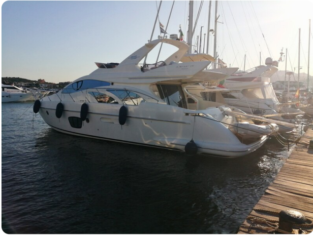
AZIMUT 55 Fly Profile