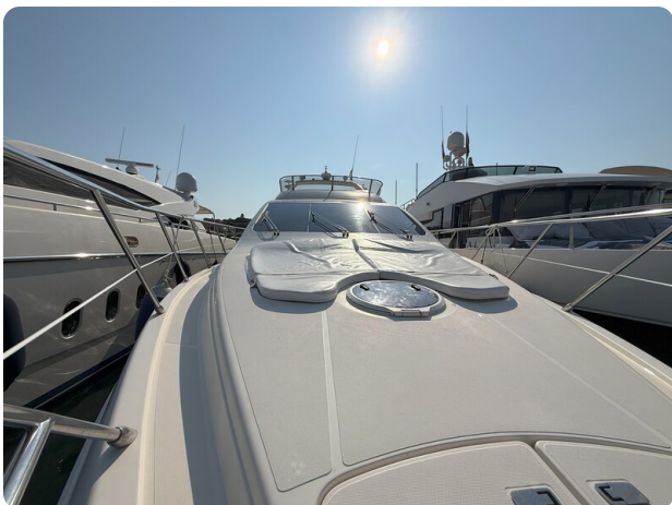
AZIMUT 55 Bow