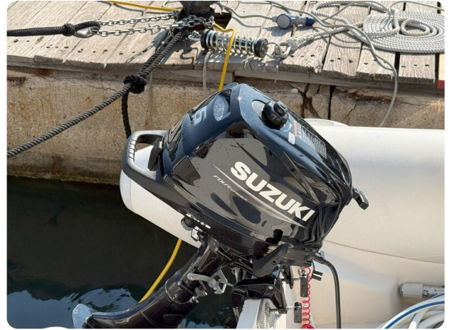
Azimut 55 new tender's engine