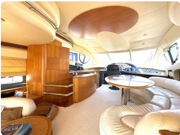
AZIMUT 55 Main Salon