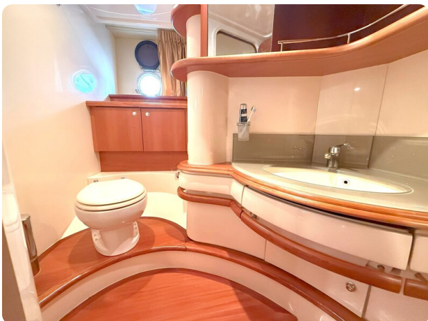
AZIMUT 55 Guest Head