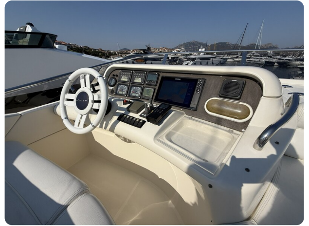
AZIMUT 55 Fly console