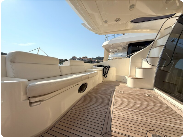
AZIMUT 55 cockpit