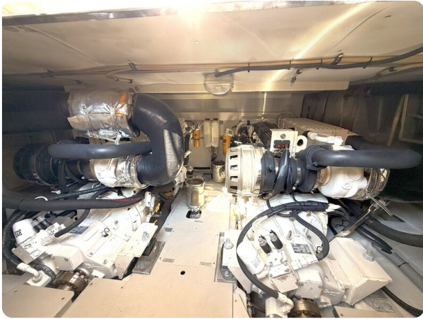
AZIMUT 55 Engine room