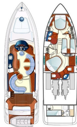
Azimut 55 fly layout