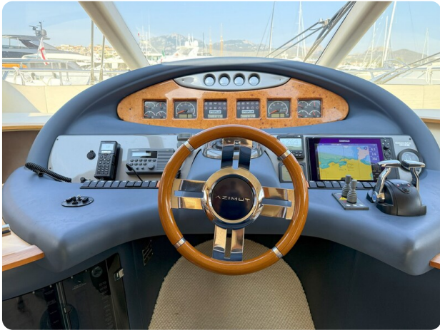
AZIMUT 55 helm station