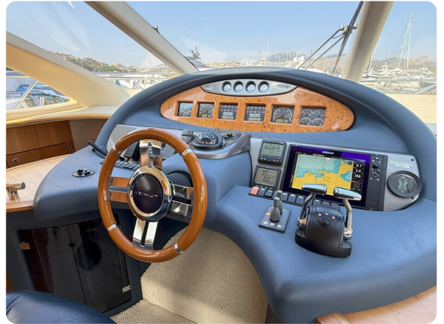
AZIMUT 55 Console detail