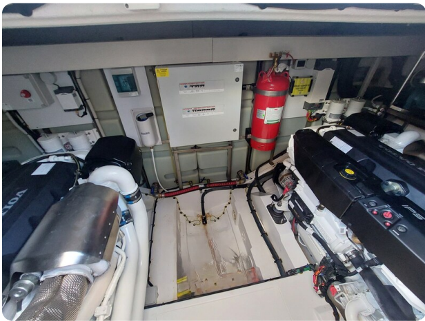
{I} Engine room