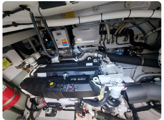
{I} Engine detail