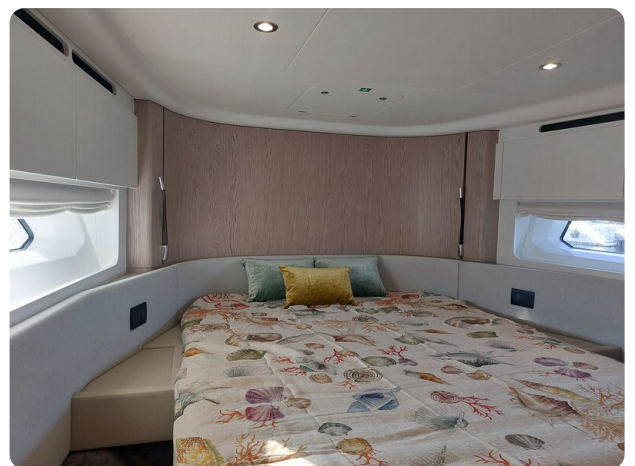
Azimut 53 Fly vip cabin