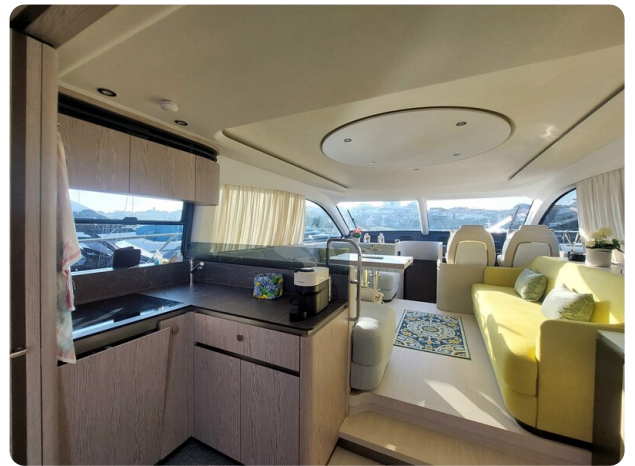
Azimut 53 Fly El Bibes-36