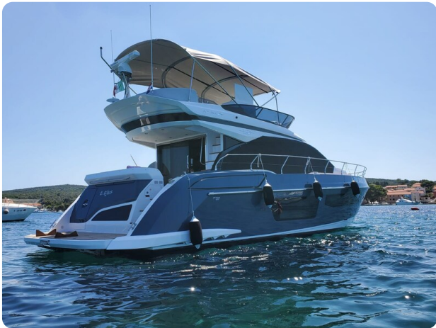
Azimut 53 Fly