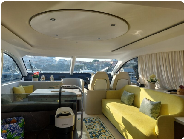
Azimut 53 Fly El Bibes-16