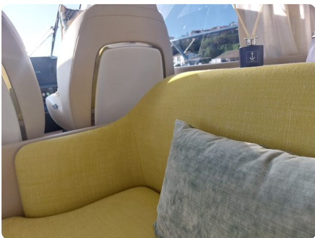
Azimut 53 Fly El Bibes-13